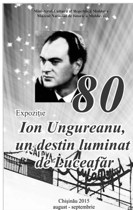
1. Afișul expoziției.

Biografia de creație a actorului și regizorului Ion Ungureanu include 13 roluri jucate în spectacole teatrale, 21 în spectacole radiofonice, 27 la „Moldova-film” și „Mosfilm”. A montat 26 de spectacole în teatru și 8 la televiziune.