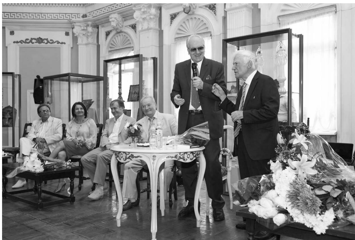
7. Secvență de la manifestarea de omagiere a actorului și regizorului Ion Ungureanu, Muzeul Național de Istorie a Moldovei, 8 septembrie 2015.

pentru noi toți de a-l trata de-această „scrântală”, cu-atât mai mare va fi meritul, dacă vom reuși... Cu încredere, Ion Ungureanu, Chișinău 2015”.