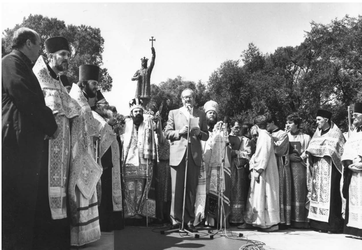
5. Ministrul Culturii și Cultelor Ion Ungureanu la manifestarea de redeschidere, după restaurare și reamplasare la locul inițial, a monumentului lui Ștefan cel Mare și Sfânt, 31 august 1990.

Pentru realizări excepționale pe tărâmul culturii, înalt profesionalism, dăruire totală propășirii neamului, ocrotirii și promovării valorilor naționale și universale, Ion Ungureanu a fost decorat cu cele mai înalte distincții de stat, premii, diplome, trofee. Unele dintre ele au fost etalate în cadrul expoziției omagiale „Ion Ungureanu, un destin luminat de „Luceafăr””: Diploma privind conferirea titlului de Maestru Emerit al artei din RSFSR (1980), Diploma privind conferirea titlului de Artist al Poporului din Republica Moldova (1989), Ordinul Republicii, decernat lui Ion Ungureanu la 27 decembrie 2009, Diploma de laureat al Premiului Național al Republicii Moldova (2011), Diplomă de laureat al premiului „Intervision” (Plovdiv, Bulgaria, 1980) pentru filmul televizat „Lica”, Diplomă la medalia „Ion Luca Caragiale” decernată pentru verticalitate și realizări de excepție în cultura națională (2007), Diploma de Doctor Honoris Causa al Academiei de Științe a Moldovei (2009), Diploma de Doctor Honoris Causa al Universității de Medicină și Farmacie „Nicolae Testemițanu”, Diploma de recunoștință a Ligii culturale pentru unitatea românilor de pretutindeni (2010),