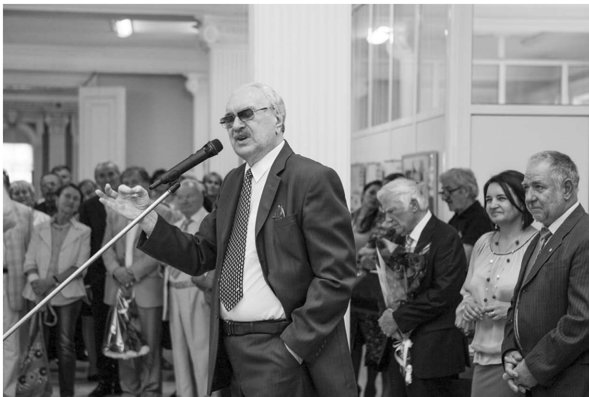
6. Secvență de la inaugurarea expoziției „Ion Ungureanu, un destin luminat de Luceafăr” .

rilor la care a fost supus pe parcursul vieții nu a îngenuncheat nici o dată în fața diavolului roșu. „L-am văzut îngenunchind de două ori în viață – spune, cu o doză de duiosie și admirație pentru gestul maestrului, Nicolae Mățaș – o dată la Putna, la mormântul Marelui Voievod Ștefan cel Mare și Sfânt (apropo: în calitate de Ministru al Culturii și Cultelor, Ungureanu a derulat procedura de canonizare a domnitorului ca sfânt de către Sfântul Sinod al Patriarhiei Române), altă dată – la Cimitirul „Bellu”, la mormântul lui Eminescu cel mare și sfânt” (Mățaș 2009, 101).