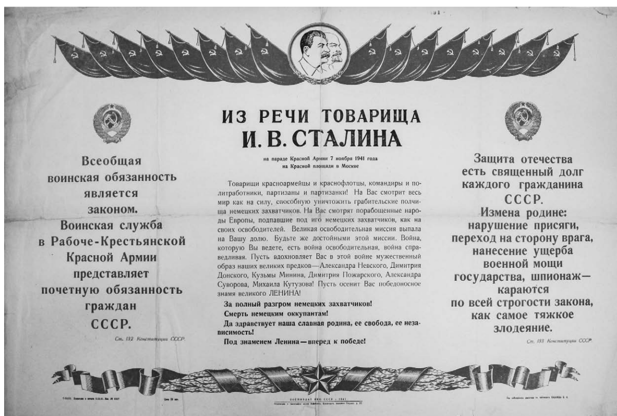
1. Afiș. Din cuvântarea tovarășului I. V. Stalin , 1941.

trei direcții principale: pe front, în fabrici și uzine și la fermele agricole, pentru a prezenta situația de pe front în termeni optimiști și convenabili, urmărind să mențină astfel moralul cetățenilor, să justifice războiul și să însușească speranță în victorie. Afișele erau tipărite în baza informațiilor primite telegrafic de pe front. În cel mult 40 de minute afișul era tipărit și apoi distribuit în sute de localități. De operativitatea apariției afișelor depindea starea de spirit a populației, numărul de noi mobilizări, randamentul întreprinderilor care produceau armament sau asigurau armata cu provizii.