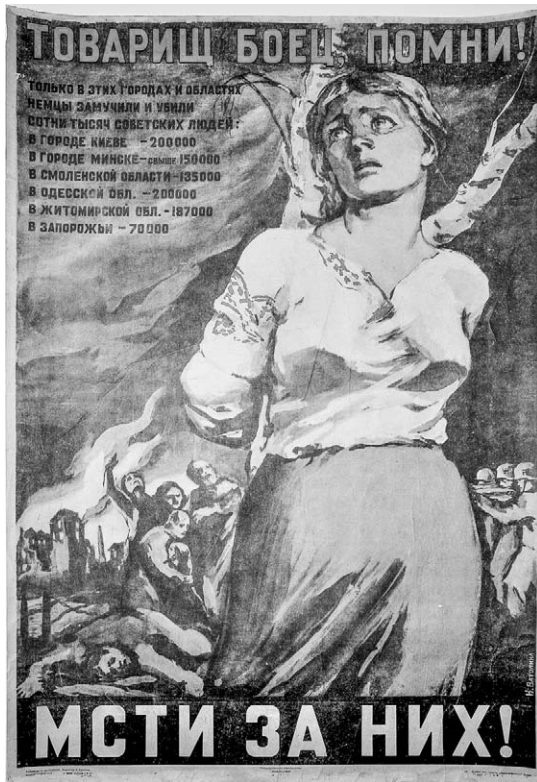
10. Afiș. Răzbună-te pentru ei! Autor N. Batolina, 1944.