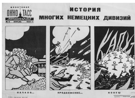
9. Afiș. Istoria multor divizii nemțești. Autor S. Pankratov, 1944.

O altă categorie de afișe din colecția muzeului sunt cele care prezintă eforturile și puterea coaliției antihitleriste. Acestea sunt variate ca design și dimensiuni și se referă la ultima perioadă a războiului, anul 1945. Aceste afișe reprezintă de regulă simbolurile de stat: drapelele, edificiile guvernamentale ale statelor aliate, fie reprezen-