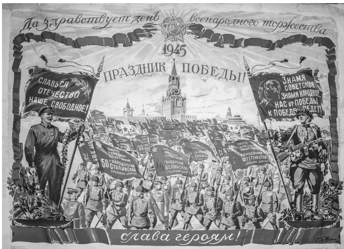
14. Afiş. Sărbătoarea Victoriei! Autor B. Muhin, 1945.

afiş impresionant este și cel semnat de pictorul P. Sarkisian, intitulat Nimicim hidra (Уничтожим гидру), 17 însoțit de un text semnat de B. Lebedev-Kumaci. Mesajul acestui afiş cheamă la nimicirea fascismului și la evitarea pierderilor de vieți omenești. Un afiş foarte expresiv este și cel creat de A. Kokorekin – Așa va fi cu fiara fascistă (Так будет с фашистским зверем) 18