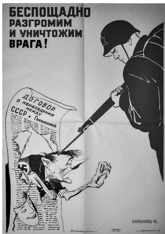
2. Afiș, Distrugem și nimicim dușmanul, fără cruțare! Autor Kukryniksy (Mihail Kuprianov, Porfirii Krilov, Nikolai Sokolov), 1941.