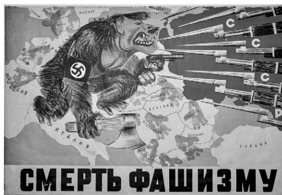
4. Afiș, Moarte fascismului! Autori V. Vlasov, T. Pevzin, T. Șișmariova, 1941.

ca aceste afișe să ajungă în orașe atât de diferite, situate la distanțe mari unul de altul, într-un timp atât de scurt. E cert că aceste afișe au fost pregătite din timp 6 . Un afiș impresionant a fost și cel creat de pictorii V. Vlasov, T. Pevzin, T. Șișmariova – Moarte fascismului (Смерть фашизму) 7