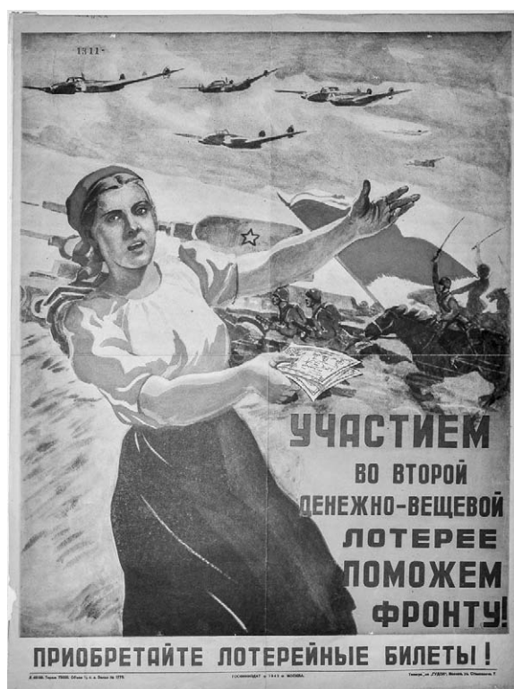
8. Afiș. Participând la cea de-a doua loterie monetară și de îmbrăcăminte, ajutăm frontul!, 1942.

Pentru anii 1943-1944 sunt caracteristice afișele care promovează succesele soldaților de pe front. În gama largă a afișelor de acest gen pot fi incluse și posterele cu genericul Spre vest ( На запад ), autor I. Ivanov; Înainte spre Vest! ( Вперед на запад ), 12 autor P. Mațev; Îi vom trage pe criminalii fasciști la răspundere pentru fărădelegile comise! ( Мы заставим немецких преступников держать ответ за все их злодеяния! ), 13 autor I. Toidze. Aici pot fi incluse și afișele care cheamă la răzbunare: Răzbună-te pentru ei ( Мсти за них ), 14 autor N. Batolina; Partizane, răzbună-te pentru patrie ( Партизан мсти за родину ), 15 autor N. Jukov etc.