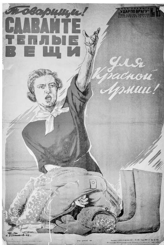
6. Afiș. Tovarăși! Adunați haine călduroase pentru Armata Roșie! Autor N. Baskakov, 1942.

afișe se referă la campania de colectare a hainelor groase pentru soldații de pe front, cum ar fi: Tovarăși! Adunați haine călduroase pentru Armata Roșie! ( Товарищи! Сдавайте теплые вещи для Красной Армии! ) 9 , pictor N. Baskakov; Confecționăm și predăm haine călduroase frontului! Ajutăm Armata Roșie să nimicească ocupații germani! ( Изготовим и сдадим теплые вещи фронту! Поможем Красной Армии уничтожить немецких оккупантов! ) 10 , pictor V. Biriukov. Un rol important l-au jucat și afișele care îndemneau populația din spatele frontului să depună banii în băncile de economii pentru susținerea eforturilor militare. Un astfel de afiș a fost cel intitulat: Participând la cea de-a doua loterie monetară și îmbrăcăminte, ajutăm frontul! ( Участие во второй денежно – вещевой лотерее поможем фронту! ) 11