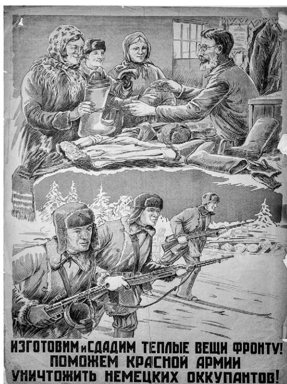
7. Afiș. Confectionăm și predăm haine călduroase frontului! Ajutăm Armata Roșie să nimicească ocupații germani! Autor V. Biriukov, 1942.