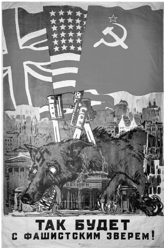
12. Afiș. Așa va fi cu fiara fascistă. Autor A. Kokorekin, 1945.