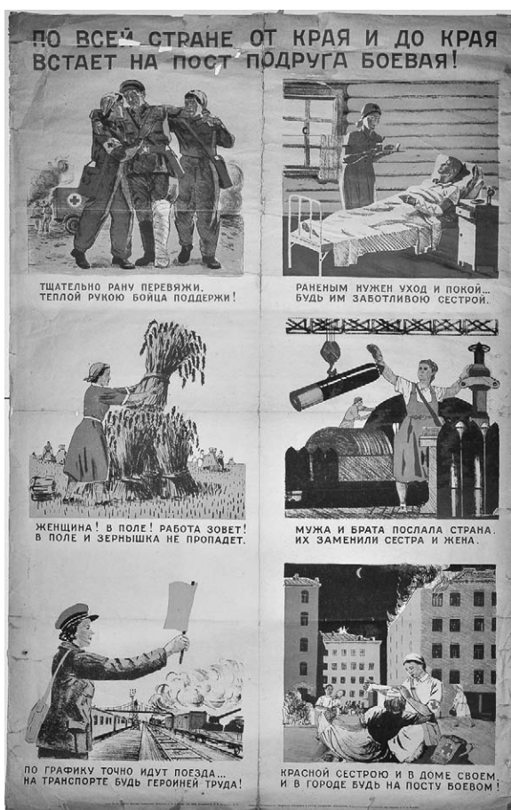
5. Afiș. În toată țara de la un capăt la altul, se mobilizează prietena de luptă! Autor A. Daineca, 1941.

Afișele create în anul 1942 îndeamnă populația din spatele frontului la susținerea eforturilor militare. Spatele frontului a constituit un factor important în asigurarea succeselor de pe front. Afișele mobilizatoare din spatele frontului reflectă creșterea rolului industriei de război în asigurarea succesului pe front. În propaganda de război sovieticii au folosit intensiv și imaginea femeii, pentru sporirea impactului emoțional, psihologic la nivel de subconștient. Femeile au ocupat locul bărbaților mobilizați pe front, în toate sferile, de la munca câmpului până la munca în uzinele de producere a armamentului. Într-un astfel de context femeia a devenit un personaj des întâlnit în afișele de propagandă sovietică. Aici se încadrează perfect afișul-colaaj În toată țara de la un capăt la altul, se mobilizează tovarășa de luptă ( По всей стране от края и до края встает на пост подруга боевая ) 8 . Autori: un grup de pictori sub conducerea lui A. Deineka. Un alt bloc de