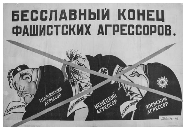
13. Afiș. Sfârșitul rușinos al agresorilor fasciști. Autor V. Deni (Denisov), 1945.