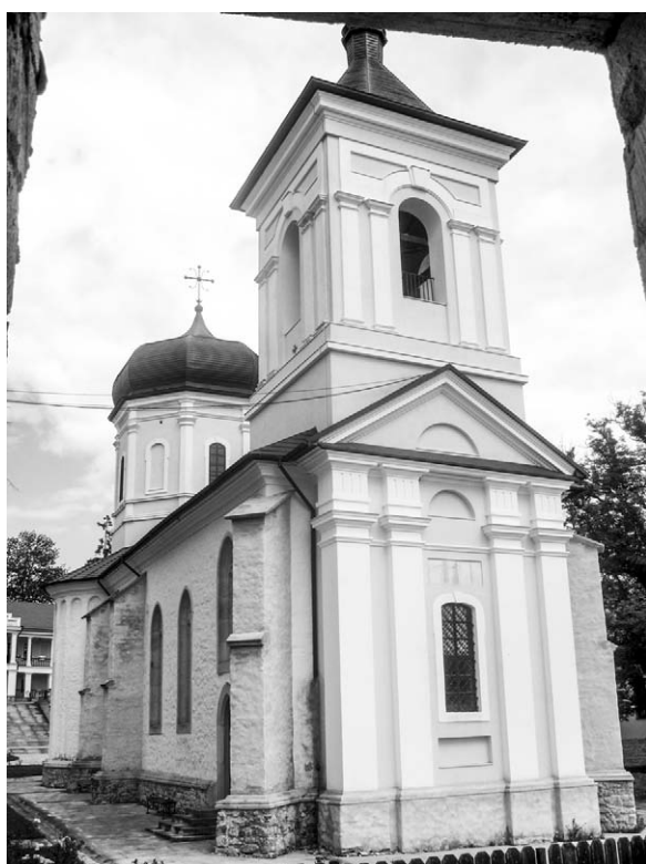
Fig. 4. Biserica Adormirea Maicii Domnului. Turnul-clopotniță.

Ținând cont de creșterea substanțială de-a lungul timpului a nivelului de călcare a solului din jurul bisericii, s-a decis ridicarea nivelului de călcare în interiorul sfântului lăcaș cu circa 35 de centimetri. Realizarea acestei decizii a dus, printre altele, la „îngroparea” părții inferioare a colonetelor angajate din pronaos. Noile pardoseli au fost executate din plăci pătrate din piatră de gresie cu latura de circa un metru.