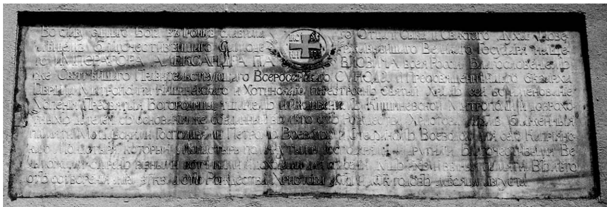
Fig. 5. Inscripția ctitoricească de pe biserica Adormirii Maicii Domnului.