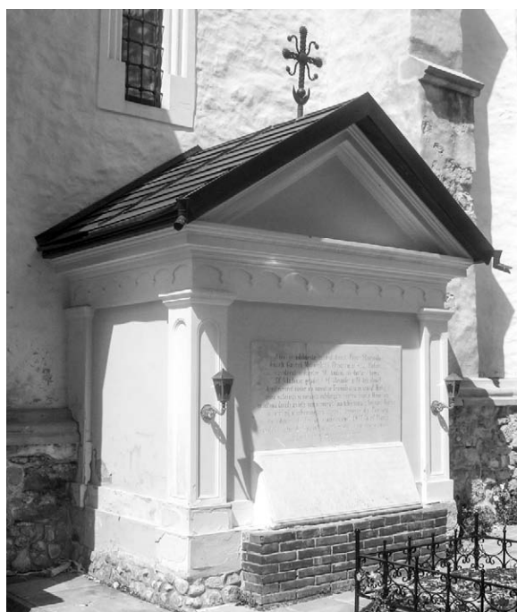
Fig. 6. Cavoul mitropolitului Gavriil Bănulescu. Inscripție tombală.

Inițiatorul și animatorul transformărilor la care a fost supusă mănăstirea, mitropolitul Gavriil Bănulescu, și-a dat obștescul sfârșit pe 30 mar-