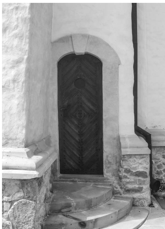
Fig. 2. Ancadramente de factură barocă. Fereastră. Ușă.