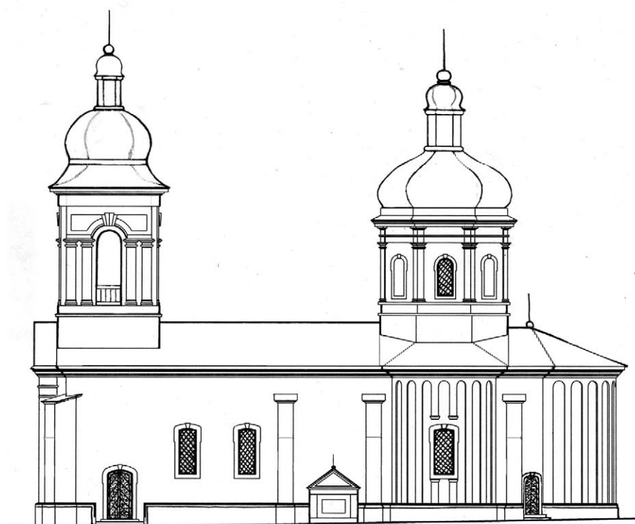
Fig. 1. Biserica Adormirea Maicii Domnului. Plan și reconstituire fațadă de sud (desen de S. Ciocanu).

a fost obținută și din demolarea acelor părți din edificiul bisericii care urmau să fie reconstruite.