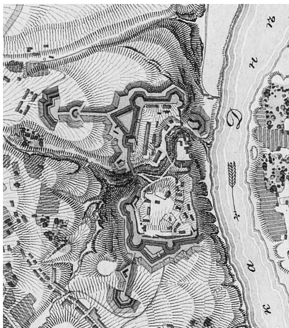
Рис. 2. План крепости Хотин (нач. 1830-х гг.; Атлас крепостей 1830-е, 62).

решраншемент, окружавшей форштат, по несоразмерной своей обширности вредный для крепости и даже могший служить неприятелю параллелью» (Некоторые военные 1816, 139-141; рис. 4).