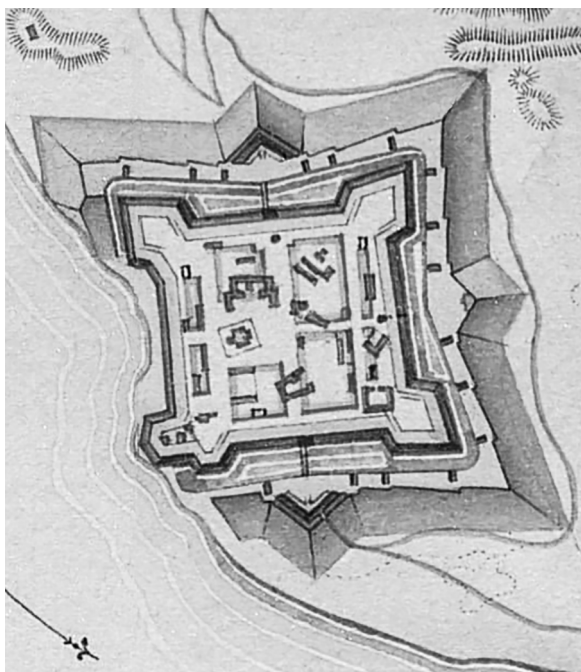
Рис. 2. План крепости Килия (нач. 1830-х гг.; Атлас крепостей 1830-е, 56).

На самом деле, если сравнить проект Килии 1794 г. с планом начала 1830-х годов, то на том оборонных объектов старой Килии сохранилось еще меньше (рис. 3). Кроме того, обращу внимание на то, что почти аналогичный проект был разработан А.Ж. де Лафиттом-Клаве в 1785 г. для форта Фанараки у входа в Босфор 6 . Хотя он не был осуществлен, Ф. Кауфер вполне мог воспользоваться им или его копией.