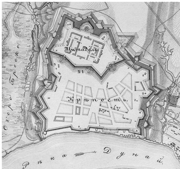
Рис. 2. План крепости Измаил (нач. 1830-х гг.; Атлас крепостей 1830-е, 54).

Некоторые положения концепции А.Ж. де Лафитга-Клаве имеются и в заключении об Измале К.И. Опшермана, из которого мы приведем фрагмент, характеризующий его реконструкцию 1790-х годов: «Измаил по нынешнему его состоянию имеет только одно название крепости, окружность ее более 2700 сажен, и профили столь слабы, что большей частью не предохраняют от открытого приступа; а глубокие с двух сторон лощины способствуют скрытному приближению к самому гласису; брустверы тонки, низки и слишком удалены от своих эскарповых стен, которыя будучи построены из худого кирпича и в недовольную толщину, не выдерживают давления земли и во многих местах весьма повреждены; по набережной части вал столь низок, что с противолежащего острова Чатала в Турецком владении состоящего, внутренность крепости открыта; сверх того ни внутренность сия, ни самые верки недефилированы от окружающих высот; из деревянных сортий две уже совершенно обрушились, и прочие угрожают падением, все внутри крепости воинские жилые и нежилые строения (кроме некоторых каменных пороховых погребов) весьма ветхи» (док. 16; рис. 2).