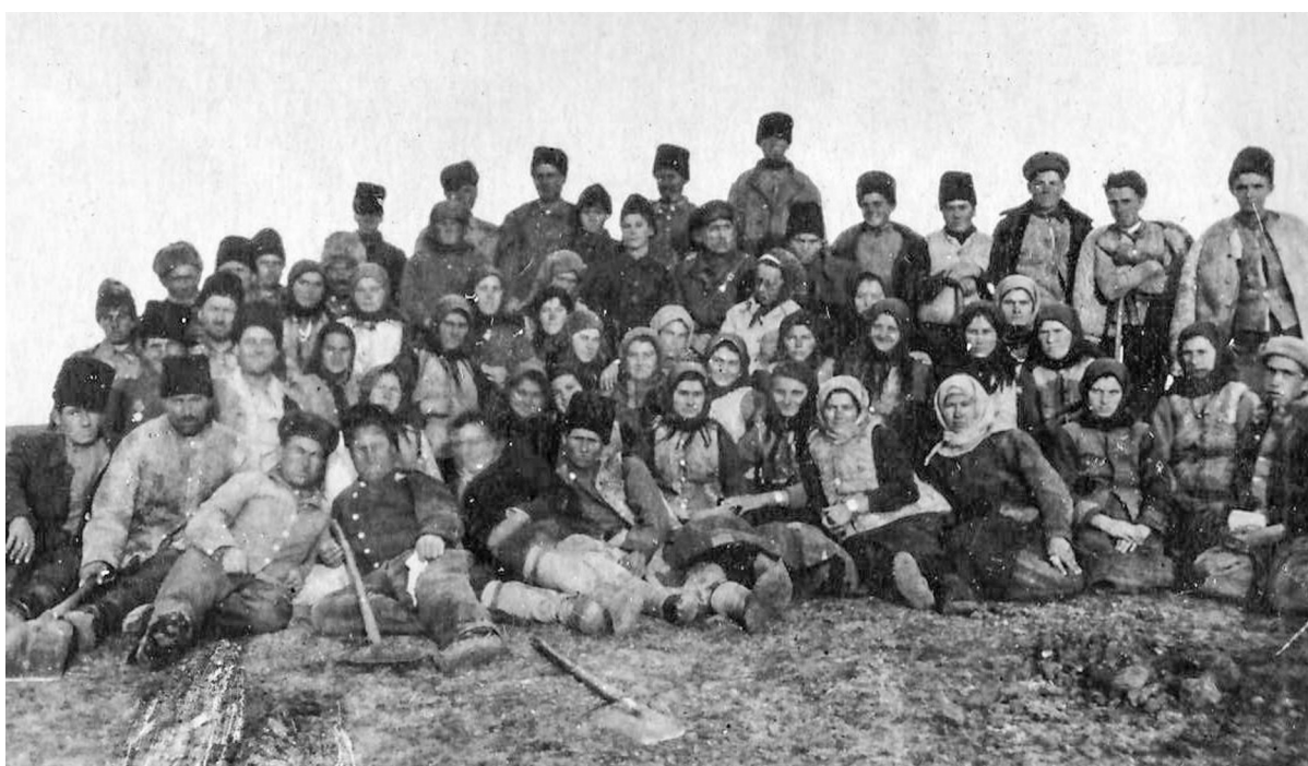
Fig. 3. Cercetările de la Gradiște. Conducerea șantierului împreună cu lucrătorii (Оболдуева 1946).

al Ținutului Natal din Ismail și cu participarea IMIELL (Капошина 1946, 227), pe care le-a continuat și în anii următori. Astfel, motivele reale ale încercării de a prelua controlul asupra cercetărilor arheologice de la Cetatea Albă sunt greu de identificat. Pe de altă parte, în anul 1946, au fost realizate cercetări neplanificate – inclusiv cele realizate la Ofatinți, Saharna și Echimăuți (fig. 4).