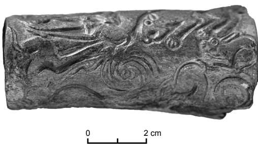
Рис. 5. Футляр из могильника Байке-2.

В пространство между передней ногой сайгака и головой крупного хищника вписано изображение зверька, сильно отличающегося от первых двух. Пастью животное устремлено к шее жертвы. Абрис приоткрытой пасти – полукруглый. Четкими линиями показан контур головы. У зверя тонкая талия, тонкий длинный хвост, тонкие короткие лапы, на которых показано по четыре длинных тонких когтя. Про-