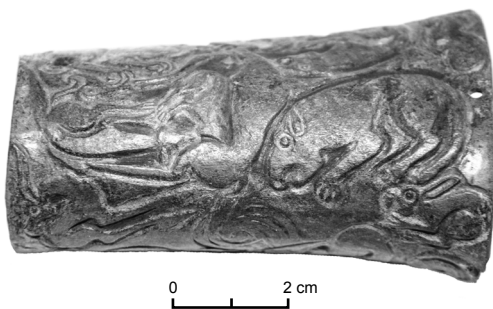
Рис. 4. Футляр из могильника Байке-2. Слева изображение оленухи, справа – зайца (?), посередине – вихревой знак.