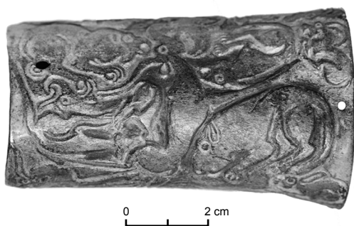
Рис. 3. Футляр из могильника Байке-2. На переднем плане центральная композиция, образованная из изображения сайгака и трех хищников.