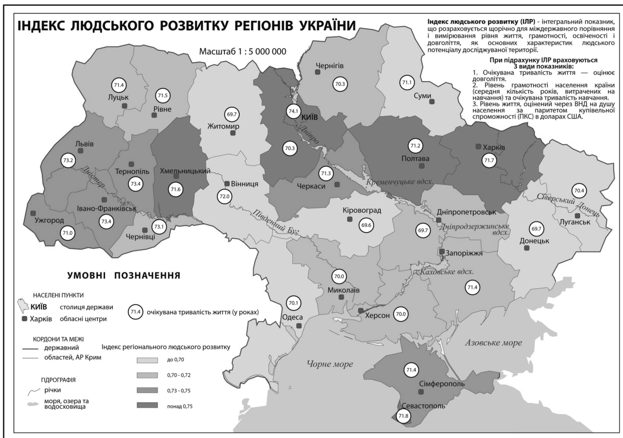
Рис. Індекс людського розвитку в регіонах України. Карта використовується під час методу «Прес»

При вивченні теми «Формування території України» пропонуємо використовувати гру-змагання «Знайди на карті місто». Для гри виготовляються картки з назвою міста. До кожної картки додається шпилька. Перед учнями вивішують адміністративну карту України. Клас, залежно від кількості учнів у