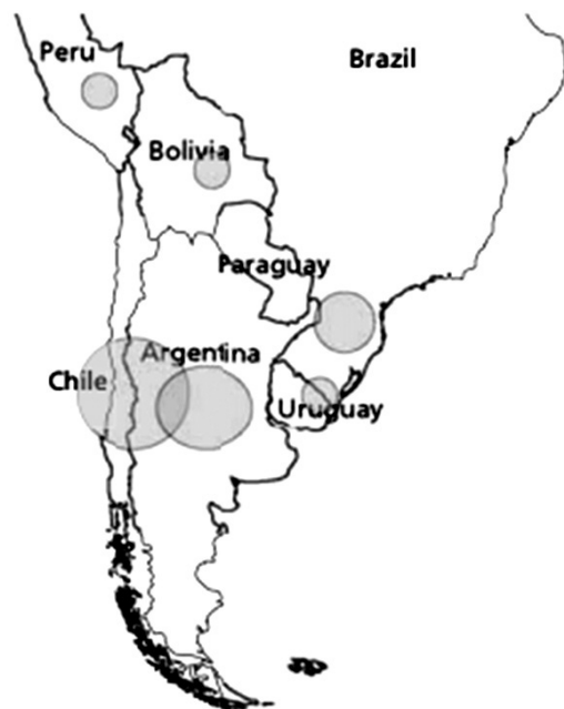
ღვინის კლასტერები სამხრეთ ამერიკაში

რადიკალური ცვლილება მოხდა 1990 წელს, როდესაც დაინერგა მიდგომა “quality over quantity” (ხარისხი რაოდენობაზე წინ) ადგილობრივ ბაზარზე უხარისხო ღვინოების მაგივრად გამოჩნდა პრემიუმ კლასის ღვინო. ამჟამად დაბალი ხარისხის ღვინის ოდენობა 2,4%-ია ხოლო 85 % უტოლდება მაღალი ხარისხის ღვინის წარმოებას. ამ პერიოდიდან დაიწყო ღვინის კლასტერების ჩამოყალიბებაც. კლასტერების ჩამოყალიბებამ ხელი შეუწყო კარგად გამოეჩინათ რა იყო მათთვის პრიორიტეტი. სწორედ ამის გამო გააუმჯობესეს ხარისხი დანერგეს ახალი მიდგომები და გახდნენ მსოფლიოსთვის მიმზიდველები ღვინის წარმოებაში. ამჟამად 500$-600$ მლნ. ინვესტიციური პროექტია მეღვინეობაში და უამრავი უცხოელი ინვესტორი არის დაინტერესებული.