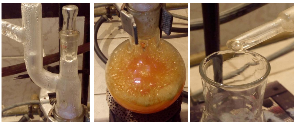
Рисунок 1 – Отримання біоетанолу з опалого листя