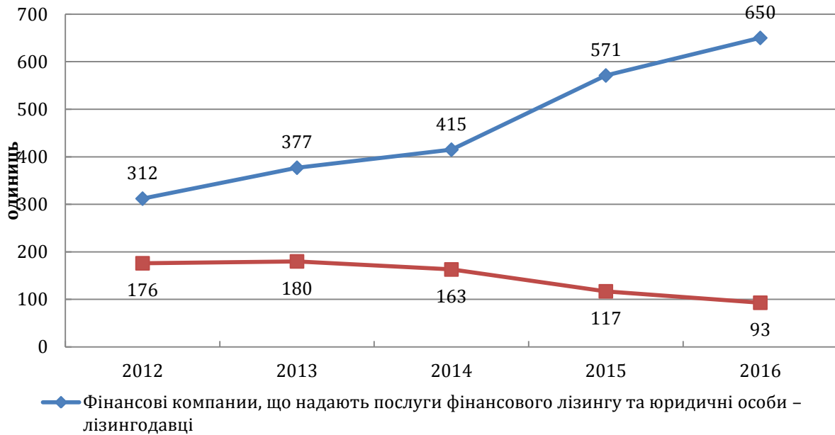
Рисунок 3 – Динаміка кількості банків та фінансових компаній в Україні в 2012-2016 рр. [11]

Для більш наочного встановлення зв'язку між змінними можна використовувати відомості, наведені на рис. 3.