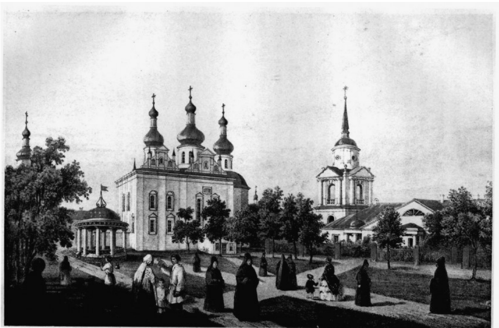
Фототипія С. В. Кульженко. Кієвъ.

Совершенно явно, что под криптонимом « Иг. П. А. » скрывается игуменья Парфения, в миру — Аполлиария Александровна Адабаш.