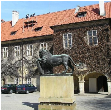
Илл. 1. Здание пражского музея национальной письменности (Památník národního písemnictví).