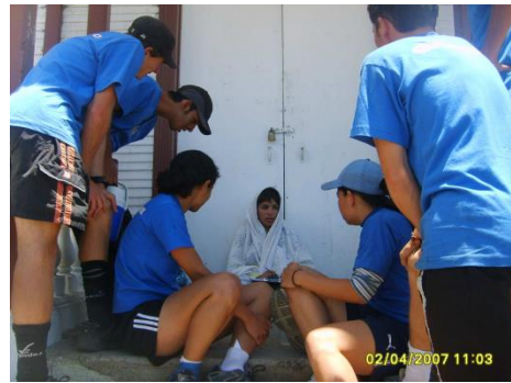
Foto Laboratorio Campamental PILOMATH 2007, Sanatorio Carlos Durán Tomada por Ericka Céspedes

Cuando te vas a dormir dejas de saber qué pasa con tu parte física y comienzas a tener vivencias en otro plano. Pasa lo mismo con alguna gente que fallece y que no quiere dejar este mundo.