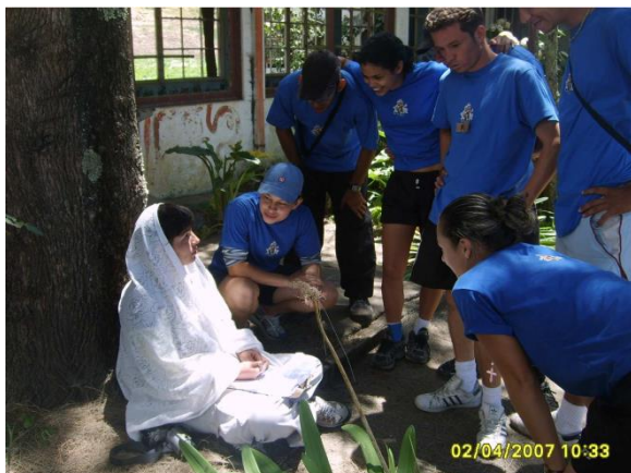
Foto Laboratorio Campamental PILOMATH 2007, Sanatorio Carlos Durán

5. Colócate a 25 metros de las ventanas y observa en su interior...dicen que una monja camina por los pasillos y se asoma a saludar... ¿la podrás ver?, si no es así acércate un poco más y busca un rostro femenino pintado en la pared...dibújalo y recoge la nueva pista.