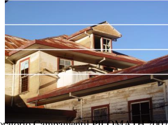
Foto Laboratorio Campamentu PLEOMATI 2007, Sanatorio Carlos Durán Tomada por María Morera

Objetivo: Conocer la historia del Sanatorio Durán (Sanatorio de los Tuberculosos), en Tierra Blanca de Cartago.