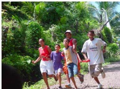
Foto Capacitación Grupo de Jóvenes, Isla Venado

Revolución Industrial, época que provocó un crecimiento del tiempo de trabajo y una consolidación efectiva de este, donde la jornada laboral es más extensa, tuvo lugar una ruptura entre el trabajo y el tiempo libre. A partir de ese momento, este es considerado el reino de la libertad (Ministerio de Educación y Ciencia, 1996).