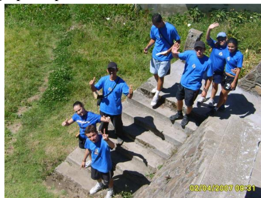
Foto Laboratorio Campamentil 2007, Sanatorio Carlos Durán Tomada por Erica Céspedes

Se les entregarán los desafíos en el centro del gimnasio, lugar a donde deben volver después de finalizar cada uno. Para cada uno habrá un juez quien verificará que las reglas se cumplan.