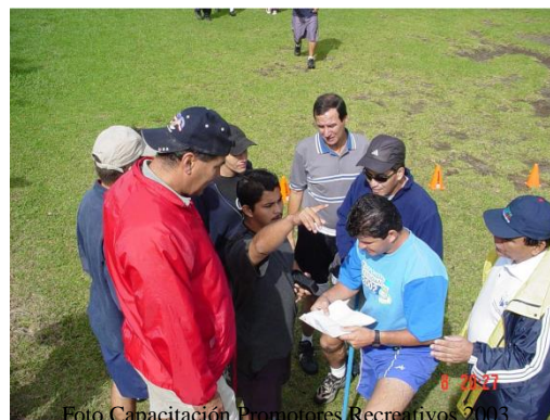
Foto Capacitación Promotores Recreativos 2003 Parque Recreativo Fraijanes

Pista 3: en el río, por donde iniciamos, encontrarás un cruce. Sigue el camino de la izquierda, pasa la pendiente, y sigue directo sobre el y al final te topará un hueco.