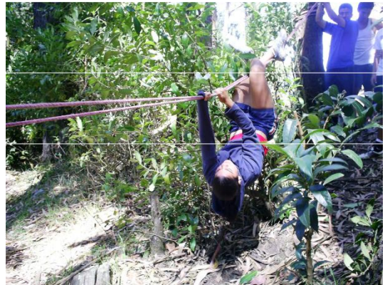
Foto Laboratorio Campamental PILOMATH 2007, Sanatorio Carlos Durán

16. Alerta nacional, los reos han escapado y están tomando rehenes, deberán lograr por medio de una cuerda colocar a tus compañeros en un lugar seguro.