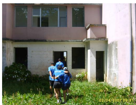
Foto Laboratorio Campamental PILOMATH 2007, Sanatorio Carlos Durán Tomado por Ericka Céspedes

3. Lo peor está por venir...ustedes han descubierto que han dejado adentro un policía y ha muerto producto de la rebelión de los reos...la siguiente pista la encontrarán donde vivía el policía fallecido.