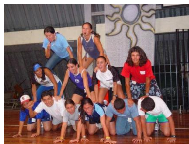
Foto Día Recreativo 2005, Escuela Ciencias del Deporte Tomada por María Morera

Una actividad que congrega a un grupo de personas. Las cuales conforman equipos, con el propósito de recorrer un territorio en un tiempo determinado, buscando o realizando acciones (pistas, acertijos o desafíos) que les permitan avanzar hasta lograr el cumplimiento del objetivo planteado.