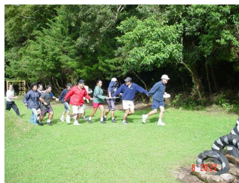
Foto Capacitación Promotores Recreativos 2003, Parque Recreativo Fraijanes

Esconderlos en un lugar seguro, de manera que no puedan ser sustraídos por extraños o por animales, ni perjudicado por las condiciones atmosféricas (viento, lluvia).