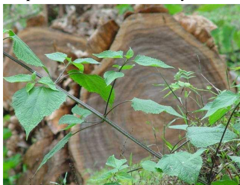
Foto Gira Bosque Eterno de los Niños, Estación San Gerardo 2005

Una vez definido el objetivo y el tema, la siguiente elección es el lugar: un gimnasio, la escuela, el parque, el centro de la comunidad, una finca; cualquiera en realidad puede utilizarse para ejecutar el rally.