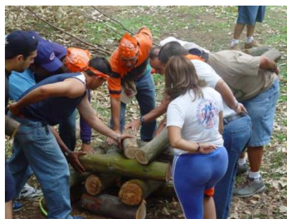
Foto Capacitación Promotores Recreativos 2004, Parque Metropolitano la Sabana

En el caso de que se trabaje con pista, una forma de controlar es que los equipos las recojan y las carguen durante todo el recorrido. Si es un acertijo una tarjeta de control donde coloquen la respuesta podría ser la solución. Y si es un desafío una clave puede ser una letra, una bandera, o un objeto.