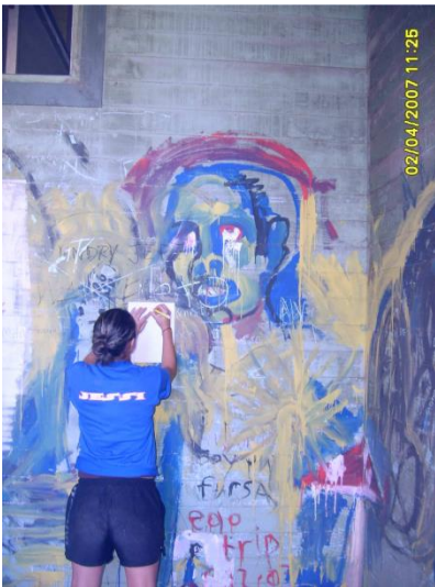
Foto Laboratorio Campamental PILOMATH 2007, Sanatorio Carlos Durán Tomado por Ericka Céspedes

22. Ahora son solo latas, pero hace muchos años sirvió para trasladar a los enfermos.