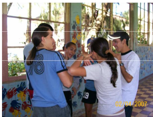
Foto Laboratorio Campamental PILOMATH 2007, Sanatorio Carlos Durán

8. Han informado que hay un niño en el salón corriendo por los pasillos...dicen que no puede encontrar su juguete y por eso ha alterado la tranquilidad del salón...busca el juguete y déjalo en el patio para que el niño no interrumpa más la labor de los enfermeros.