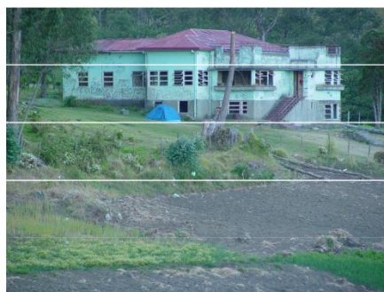
Foto Castillo, Sanatorio Durán 2007

1. Le llaman el castillo, su color es como el cielo, cuenta la historia que ahí dormían las monjas y también los administradores...deberán subir a la cima marchando al mismo son, no deben desafinar, sus pasos firmes deben sonar. El objetivo será, libertar todos los temores para luego echarlos a volar... (Los estudiantes, escriben en una hoja una palabra o una frase que les este provocando temor, angustia, miedo, etc. Producto del rally o de su vida cotidiana... Una vez hecho esto, hacen el papel en forma de avión y lo liberan por una de las ventanas. (Que deberán recoger al salir del castillo)