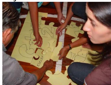
Foto Campamento Padres y Madres Grupo 02 2005, Escuela Ciencias del Deporte, UNA Tomada por María Morera

Grupos: cuatro grupos divididos equitativamente, requisito que no se conozcan entre si.