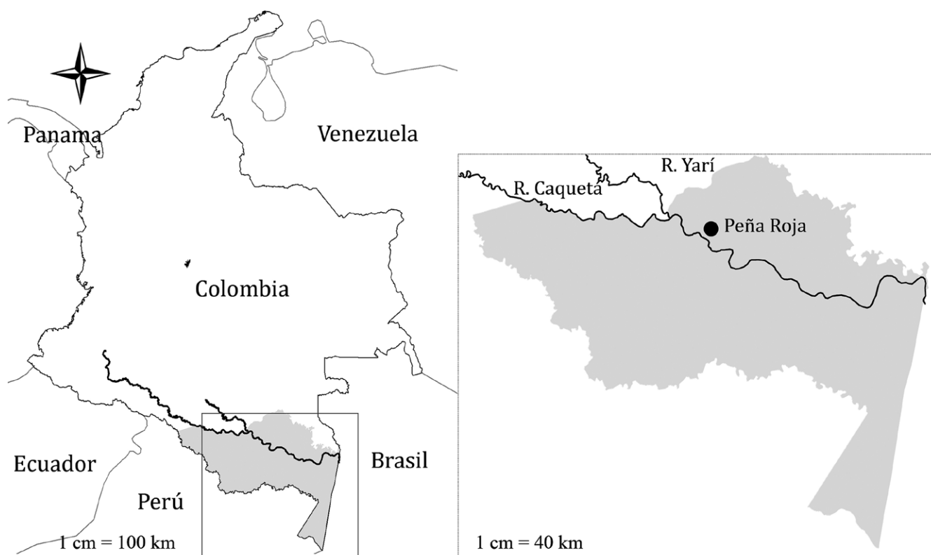
Figura 1. Localización del área de estudio en la región de Araracuara, Amazonia Colombia (arriba).