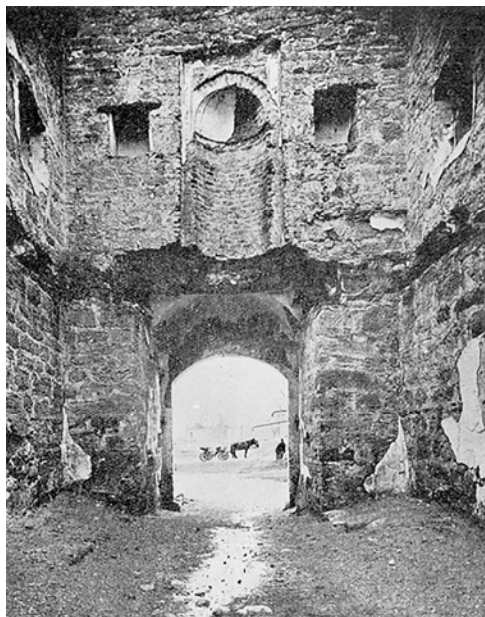
Рис. 1. Внутренний вид Султанской мечети во входной башне цитадели (фото 1928 г.) [34].