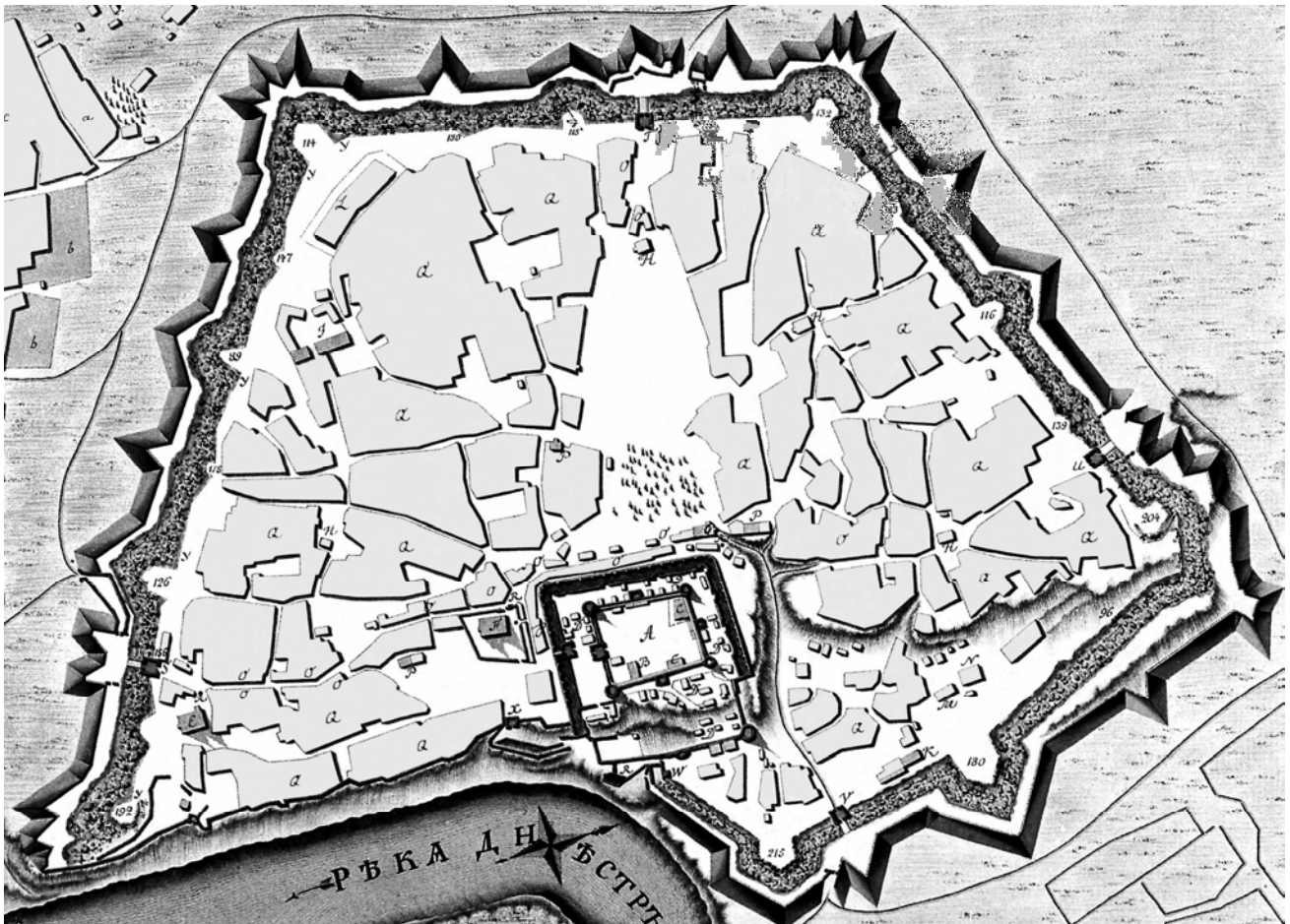
Рис. 4. План Бендерской крепости 1790 г. А – каменный замок из башен соединенных зубчатыми стенками со вром; в нем: В – цейхгауз и С – пороховые погреба (каменные); D – обывательские строения; Е – Соборная церковь Святого Георгия в крепости; Каменные, освященные из мечетей: F – церковь Святой Троицы, G – армянская церковь; Н – мечети; G – бывший арсенал; К – цейхгауз; L – провиантский магазин; М – бывшие мучные мельницы; N – бывшие пекарни; О – купеческие лавки; Р – каменные бани; Q – обывательское строение; R – фонтаны каменные и бассейны; Ворота: S – Цареградские, Т – Ардынские, U – Варницкие, V – Водяные, W – Каменные, X – Табакские, Y – сортии [малые форты, редуты]; В форштадте: а – обывательское строение, б – выжженное турками строение.