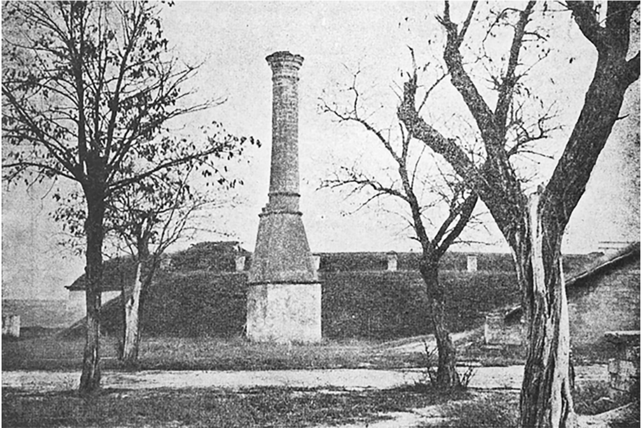
Рис. 5. Минарет Соборной мечети (фото 1928 г.) [36].