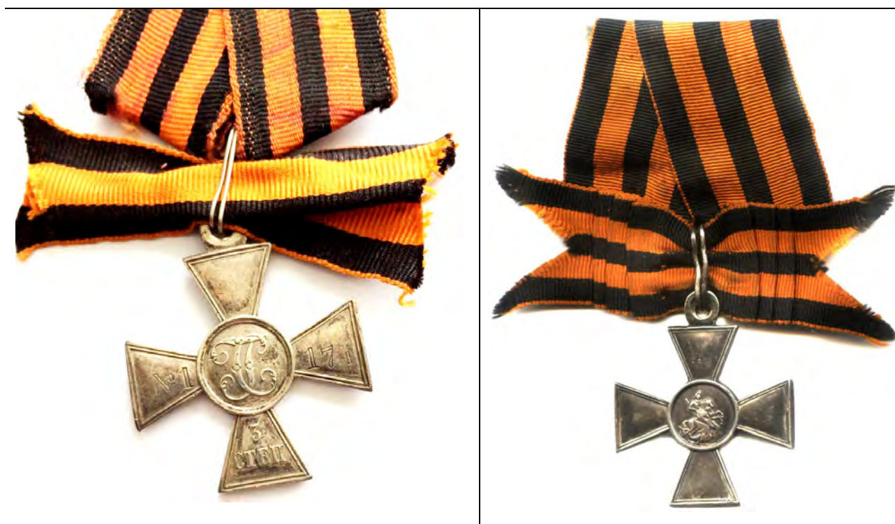
Рис. 7-8. Георгиевский крест III степени № 1174 Д.Е. Дзюбика. Лицевая и оборотная стороны. Из коллекции авторов