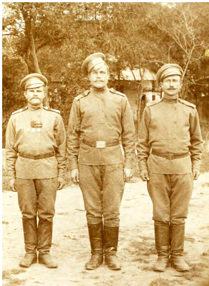
Рис. 3. Солдаты 254-го пехотного Николаевского полка.