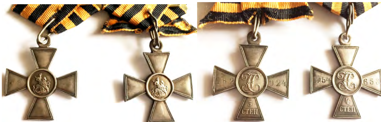
Рис. 5-6. Георгиевские кресты III степени № 162024 и IV степени № 54653 М.С. Капусты. Лицевая и оборотная стороны. Из коллекции авторов