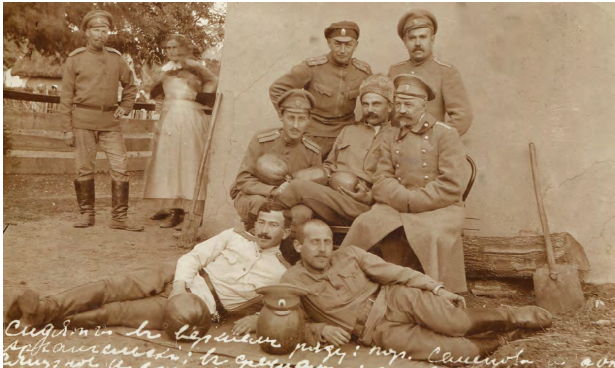
Рис. 10. Офицеры 254-го пехотного Николаевского полка, 8 октября 1917 года.