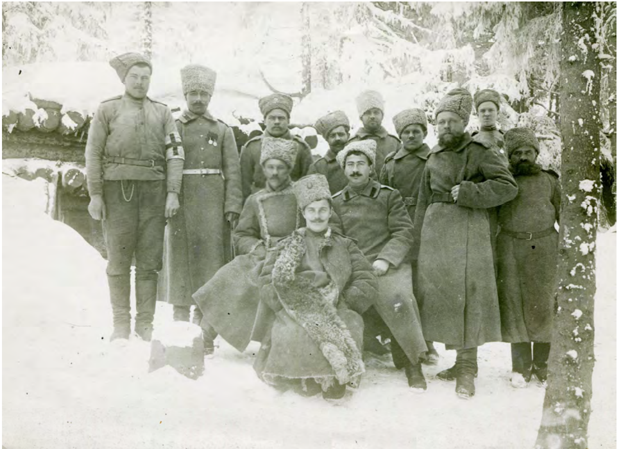
Рис. 9. Воины 254-го пехотного Николаевского полка возле блиндажа.