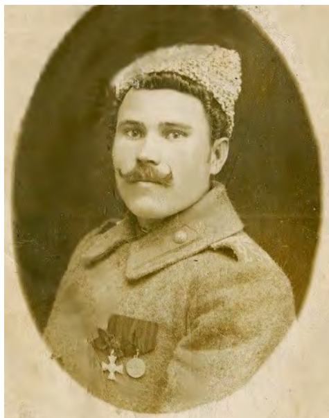
Рис. 4. Солдат 254-го пехотного Николаевского полка, награжденный Георгиевским крестом.