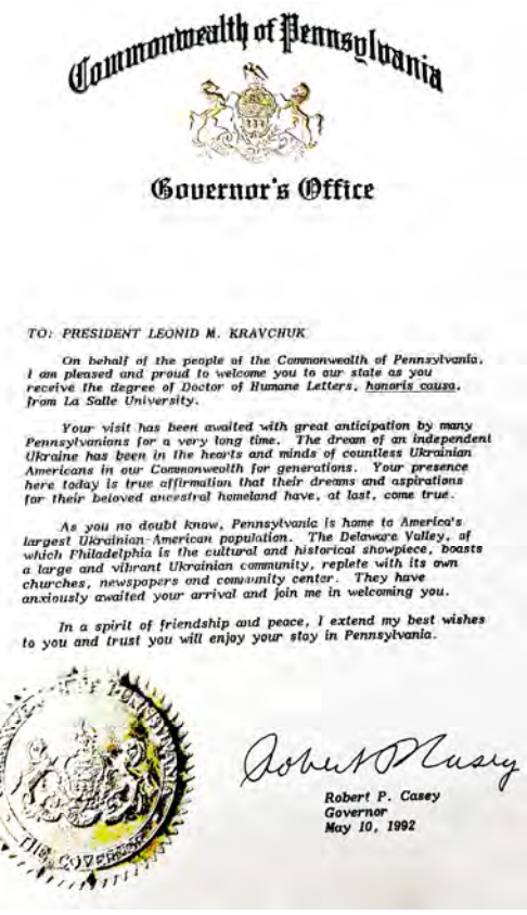
Ілюстрація 4. Привітання Президентіві України Л. Кравчуку від губернатора Пенсільванії