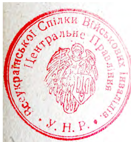
Іл. 1. Відтиск печатки Всеукраїнської спілки військових інвалідів УНР, Тарнів (Польща), 1922 р. (Центральний державний архів вищих органів влади та правління України, ф.1075, оп.2, спр.822)