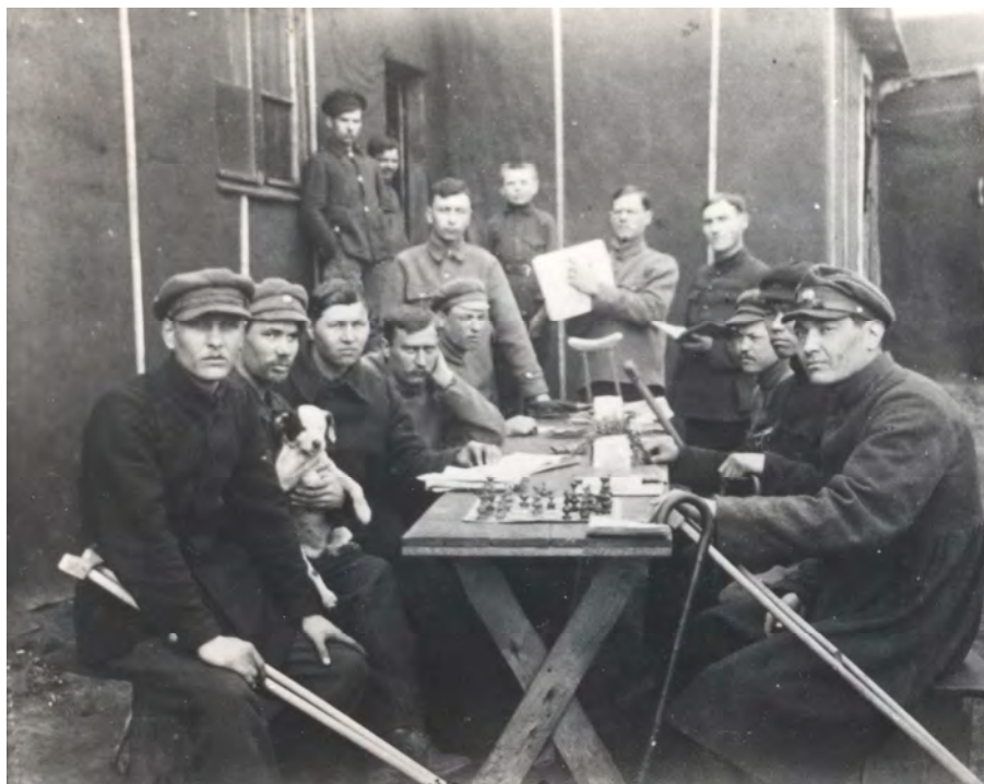
Іл. 3. Група інвалідів Армії УНР, інтернованих у таборі Каліш, Польща, 1921 р.