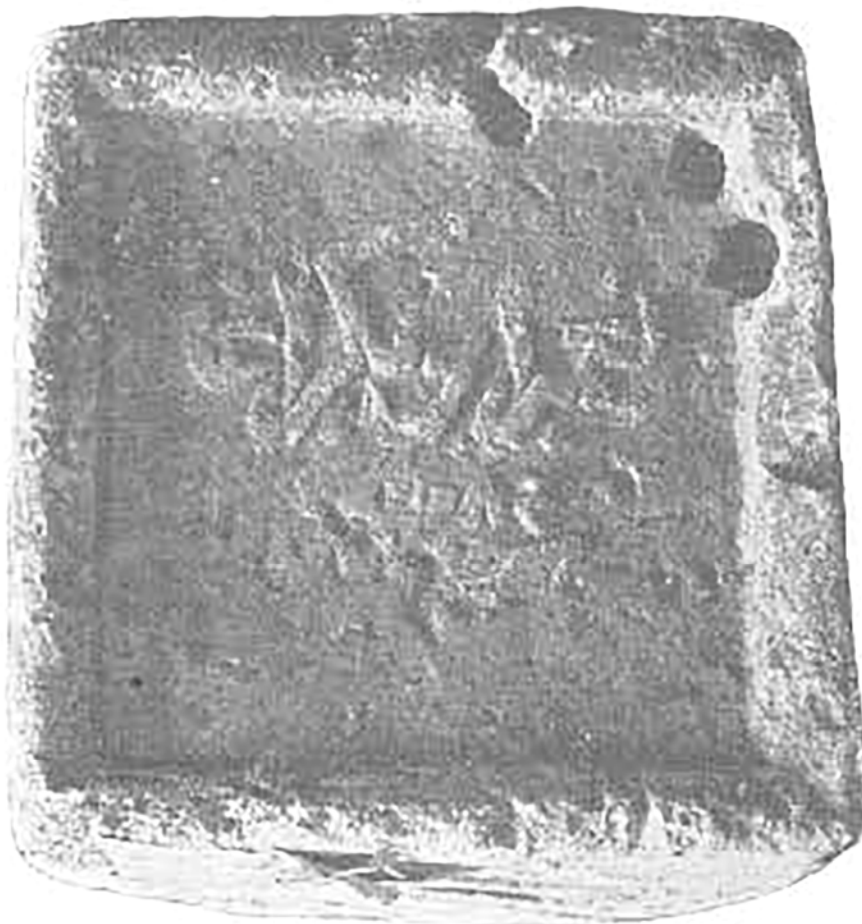
Рис. 3. Строительная надпись 1673 г.