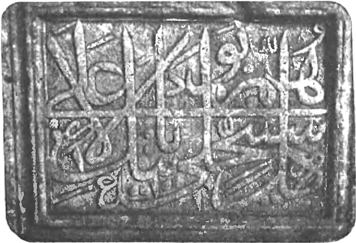
Рис. 2. Охранная надпись с мечети