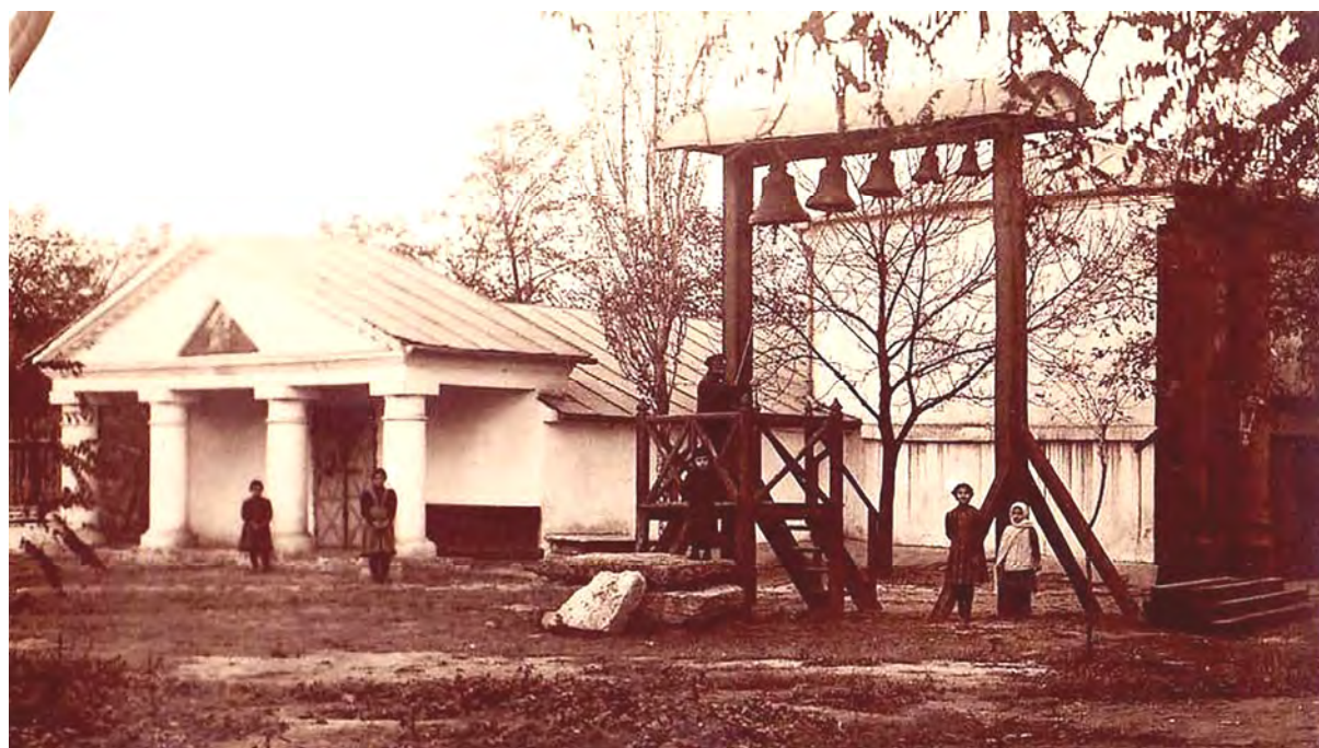
Рис. 5. Армянская церковь (фотография нач. XX в.)