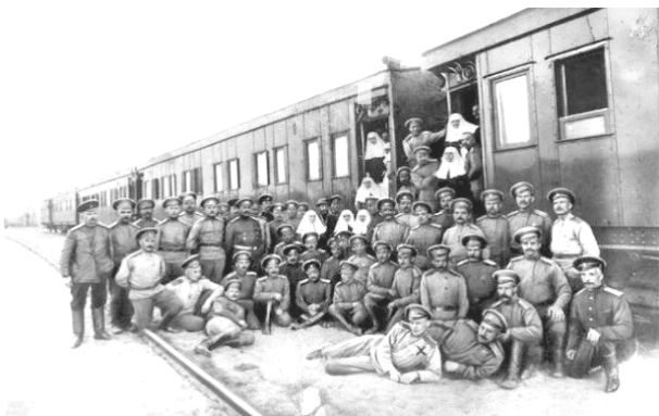
Санітарний поїзд російської армії (1915 рік)

покласти на його заступника Є.І. Блока»[7]. До відома, Галиційські залізниці – це на той час військово-польові залізниці на території тимчасово відвойованої у Австро-Угорщини української Галичини.