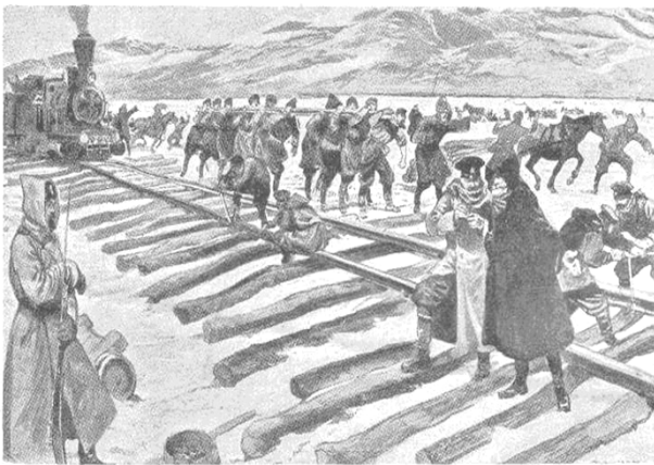
Постройка жельзной дороги через Байкаль. Рис. Т. Копала.

На початку ХХ ст. Російська імперія вперше зіткнулася з необхідністю організації масштабних залізничних військових перевезень, але не в європейській частині держави, не в Україні, як можна було очікувати, а на Далекому Сході – під час російсько-японської війни (1904-1906). Цей досвід виявився негативним через недостатньо чітку організацію руху на тільки-но збудованій Транссибірській магістралі. Основною проблемою тієї війни було забезпечення достатніх пропускної та провізної можливостей залізничних ліній, чого фактично не було зроблено в силу цілої низки як об'єктивних, так і суб'єктивних причин. У результаті Росія зазнала поразки у цій кампанії, втратила території та контроль над частиною китайсько-східної залізниці, що, звичайно, відобразилось на загальному економічному та політичному стані імперії та призвело до першої російської революції 1905-1907 років.