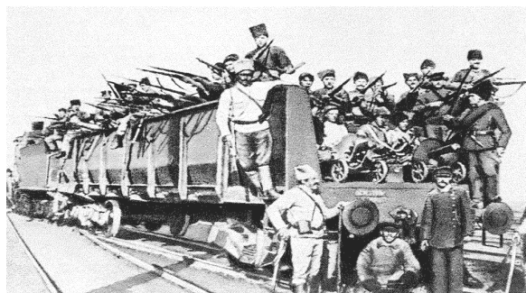
Загін червоної армії перед відправкою залізницею на Південний фронт (1919 рік)