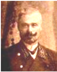
Євген Сокович (фото 1912 року)

У грудні 1919 року, коли фронти відійшли на південь, В.О. Сокович очолює Владикавказьку залізницю – теж прифронтову, у той час незакінченої громадянської війни, у Криму – війська барона Врангеля, на Закавказзі – національні уряди. У Москві дуже цінували здібності В.О. Соковича, як організатора військових перевезень в екстремальних умовах. Тут він продовжує наукову роботу, яку ніколи не залишав у найтяжчі воєнні роки. І під час викладання у 1919-21 роках дисципліни «Експлуатація залізниць» у Кубанському політехнічному інституті у Володимира Олександровича з'являється можливість підготувати до публікації свій рукопис, що узагальнював, у тому числі і військовий досвід керівника, інженера-експлуатаційника. Отже у 1923 р. у Москві з'являється монографія В.О. Соковича «Вагонне і паровозне господарство» [9], що по суті була його дисертацією, за яку він отримав вчене звання «професор», учені ступені (доктор наук, кандидат наук тощо) з'явилися у СРСР тільки у 1930-ті роки.