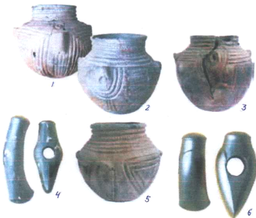
Мал. 4. Горщики катакомбної культури та кам'яні сокири знайдені в курганах:

1 – с. Актове, 2 – с. Булгакове, 3 – с. Антонівка, 4 – с. Веселий Кут, 5 – с. Новопетрівка, 6 – с. Новогригорівка (Фонди ІА НАНУ)