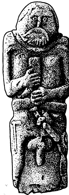
Мал. 3. Статуя скіфського вождя с. Нововасилівка (Г.Л. Євдокимов)