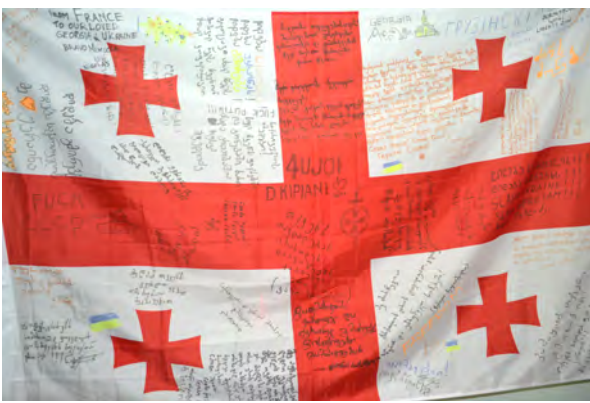
Рис. 2. Прапор Грузії з автографами бійців «Грузинського легіону» (із колекції НМІУ)