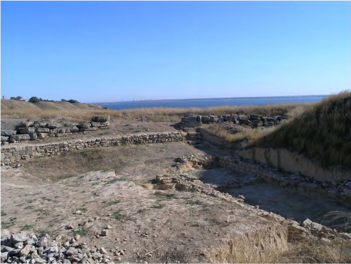
Рис. 1. Северная часть цитадели. Куртины № № 6, 8. Помещение “казармы”. Вид с Ю-З.