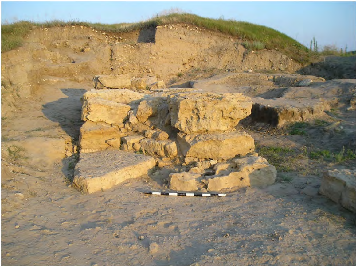
Рис. 3. Западная прирезка. Куртина № 77. Вид с В.