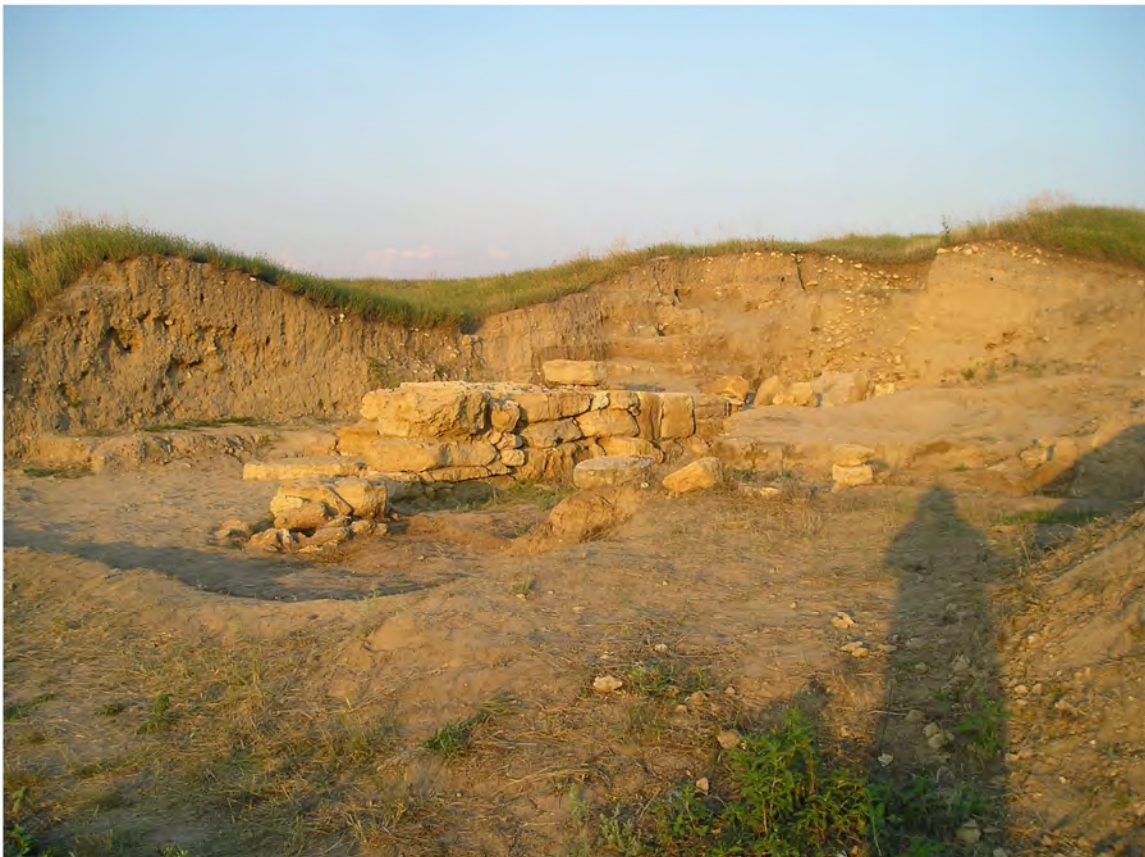
Рис. 2. Западная прирезка. Северо-западная куртина № 77. Вид с С-В.