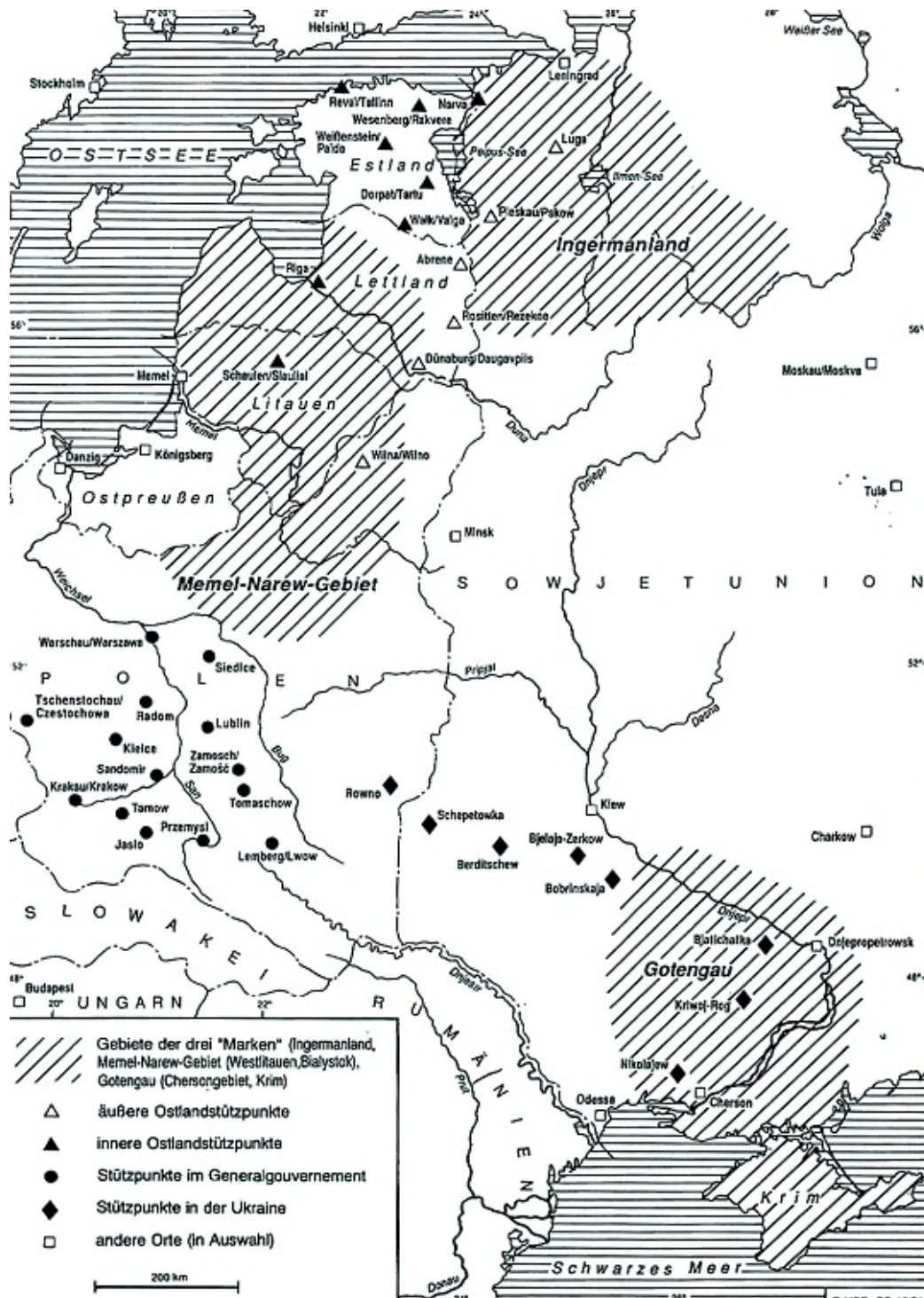
Карта «Німецькі колонізаторські центри на території України»*