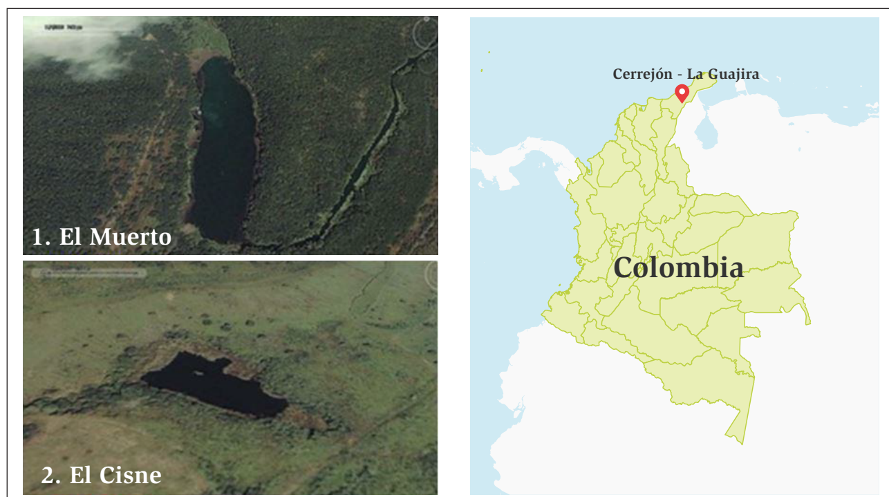
Figura 1. Localización de las lagunas El Cisne y El Muerto. En la parte superior se observa la laguna El Muerto, mientras que en la parte inferior la laguna El Cisne. Tomado y modificado de Google Earth.

se utilizó una atarraya con ojo de malla de 0,5 cm y se fijaron en formol al 10 %. Los avistamientos de aves y otros vertebrados se desarrollaron con el método de muestreo relevamiento por encuentros visuales (Gallina y López-González, 2011). Para el avistamiento de aves se utilizaron binoculares marca Bushnell 17-5010. La identificación de las aves se realizó con ayuda de la guía de Steven (2001) y la de los reptiles con Angarita-Sierra et al. (2013).