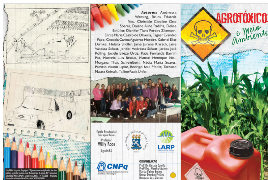
Figura 3 – Folder “Agrotóxicos e meio ambiente”.

acompanhados pela diretora da escola e pela pesquisadora. Foi realizada a explanação da principal função do folder: capacitar os alunos na elaboração e divulgação do material informativo.