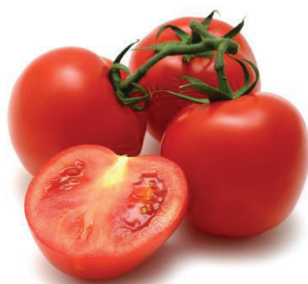
Figura 2- Licopeno, principal componente responsável pela coloração vermelha de tomates

Os carotenoides são considerados um grupo de compostos responsáveis pela coloração amarela, laranja e vermelha de alimentos de origem vegetal e alguns de origem animal. Sendo que o licopeno é o responsável pela cor vermelha do tomate, melancia, goiaba, mamão e pitanga (WONG, 1995). Entre os carotenoides obtidos do tomate (Figura 2) destacam-se o licopeno e o \beta -caroteno. A coloração verde dos tomates imaturos se deve pela presença de clorofila, a qual degrada durante o processo de maturação, formando os pigmentos amarelos (carotenoides e xantofilas), tendo em vista que a cor vermelha se deve ao acúmulo de licopeno, que representa 80-90% do pigmento em tomates maduros, principalmente na casca (SHI; LE MAGUER, 2000).