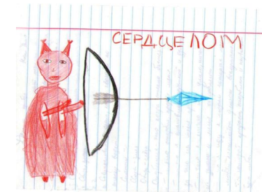
Рис. 3. «Сердцелом»

Тогда учитель учится искусству творения взаимоотношений без подавления и насилия, а его внутренний мир становится источником возвышенных и прекрасных образов, входящих в земную жизнь через пространство урока и питающих его чистым светом.