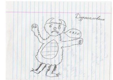
Рис. 2. «Дурнословник»