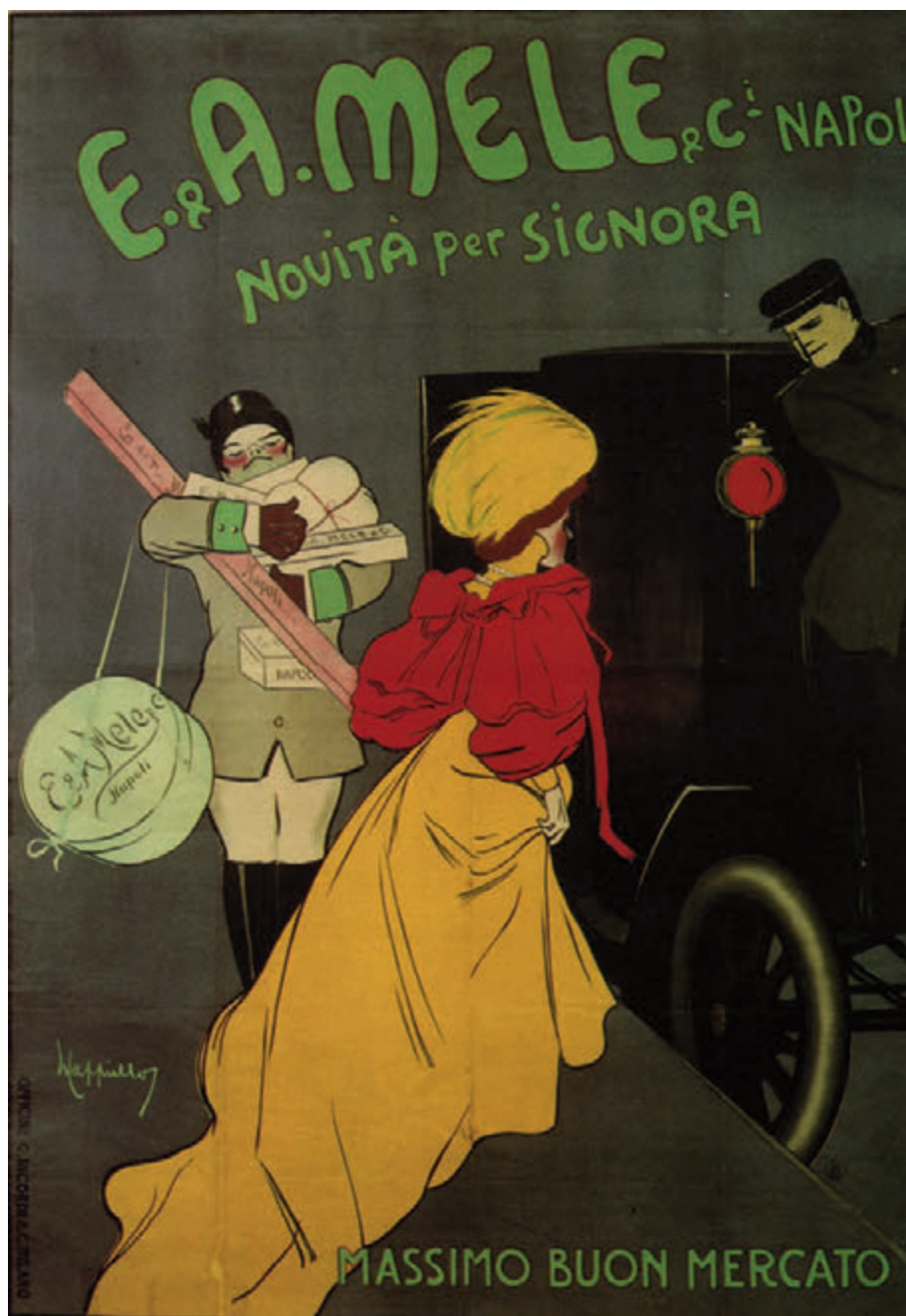
Mele. Cappiello, 1907. 210 x 150 cm. Raccolta Salce n° 18748. Museo Civico Luigi Bailò, Treviso.