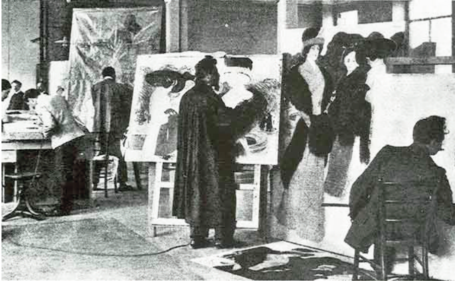
Sala de pintores en Ricordi, Milán.