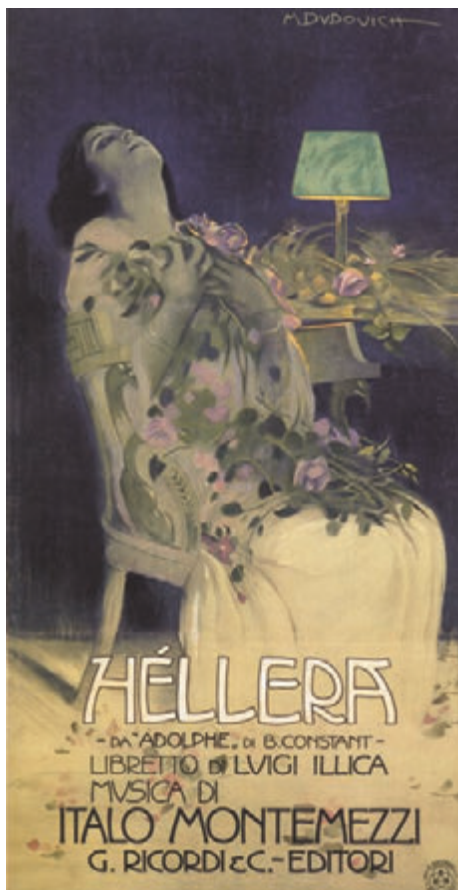
Héllera . Dudovich, 1909. 200 x 105 cm. Raccolta Salce n° 4014. Museo Civico Luigi Bailò, Treviso.