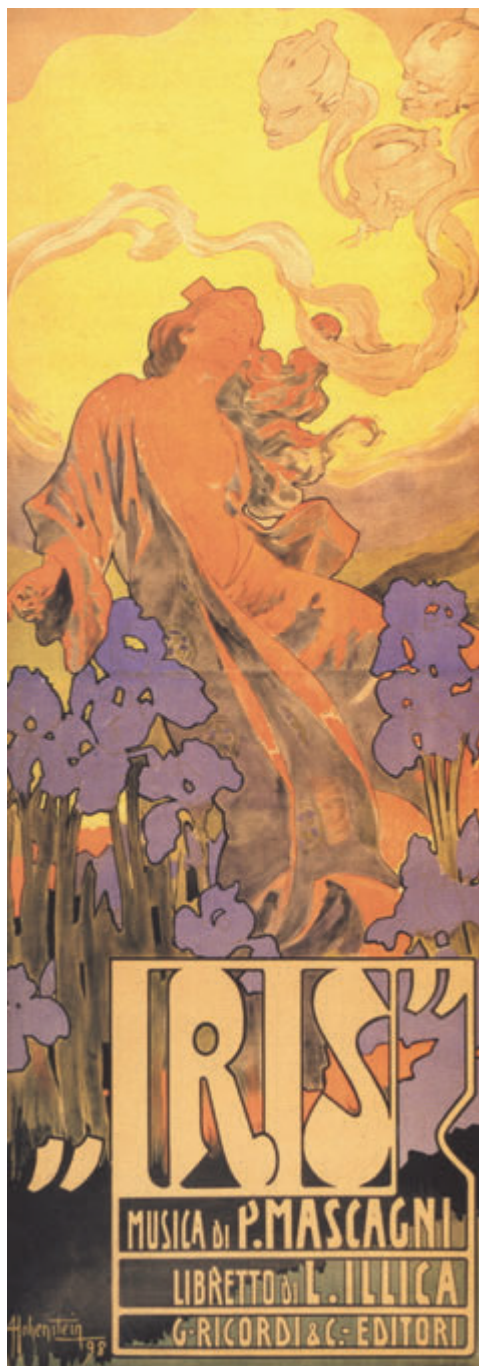
Iris . Hohenstein, 1898. 275 x 96cm. Raccolta Salce n° 13380. Museo Civico Luigi Bailò, Treviso.