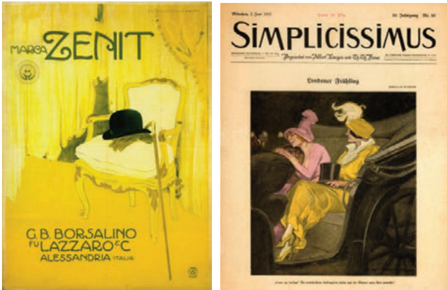
Marca Zenit . Dudovich, 1911. 140 x 105 cm. Raccolta Salce nº 4047, Museo Civico Luigi Bailò, Treviso. A la derecha, Simplicissimus . Dudovich, 1913.