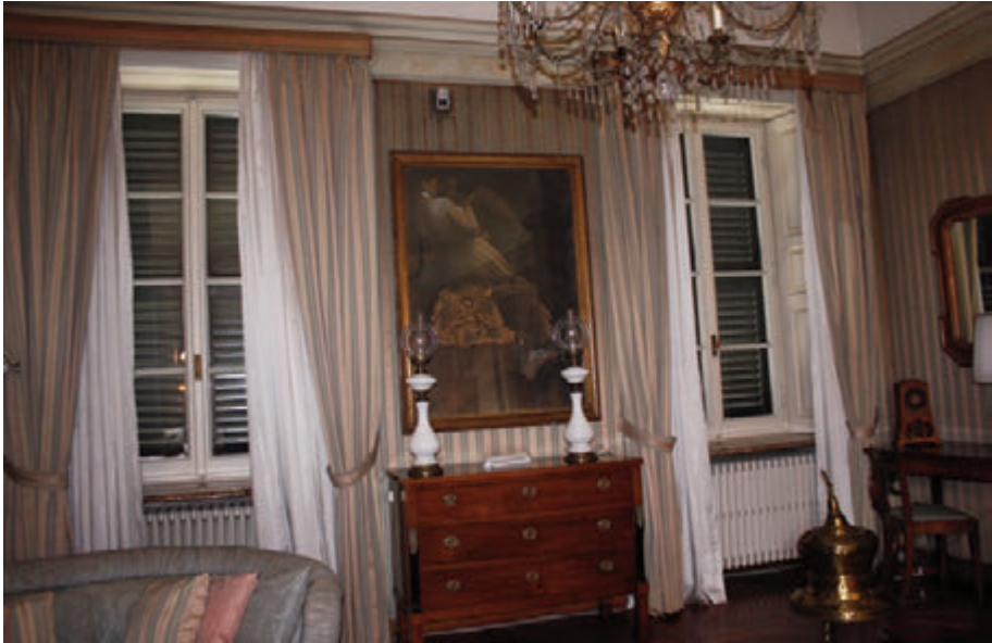
Salón de la casa familiar Campari (Sesto San Giovanni, Milán). En la pared, boceto de Dudovich.