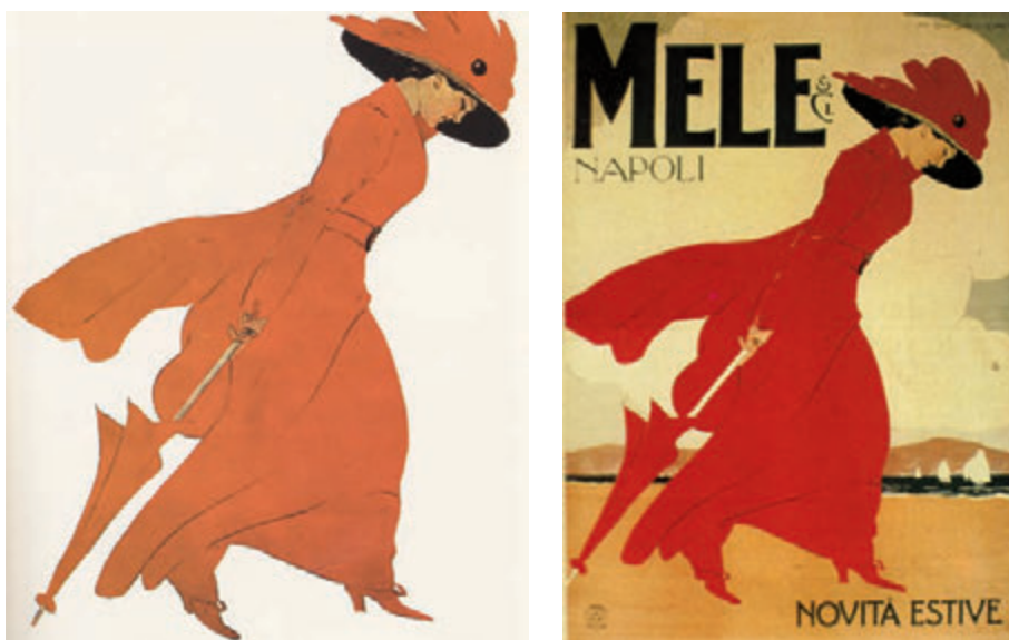
Boceto y cartel Mele . Dudovich, 1908. 205 x 145 cm. Raccolta Salce nº 4032. Museo Cívico Luigi Bailò, Treviso.