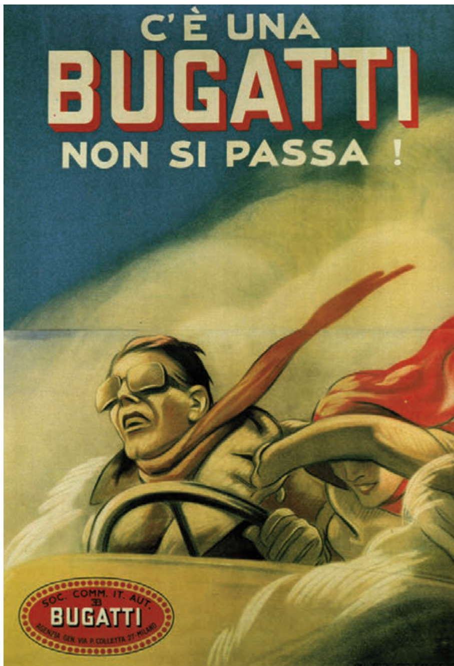
Bugatti. Dudovich, 1921. 195 x 140 cm. Raccolta Salce n° 3839. Museo Civico Luigi Bailò, Treviso.