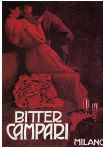
Bitter Campari . Dudovich, 1901. 140 x 98 cm. Raccolta Salce nº 3976. Museo Civico Luigi Bailò, Treviso.