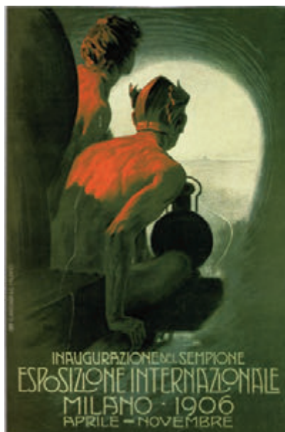
Inaugurazione del Sempione . Metlicovitz, 1906. 100 x 70 cm. Raccolta Salce n° 2656. Museo Civico Luigi Bailò, Treviso.