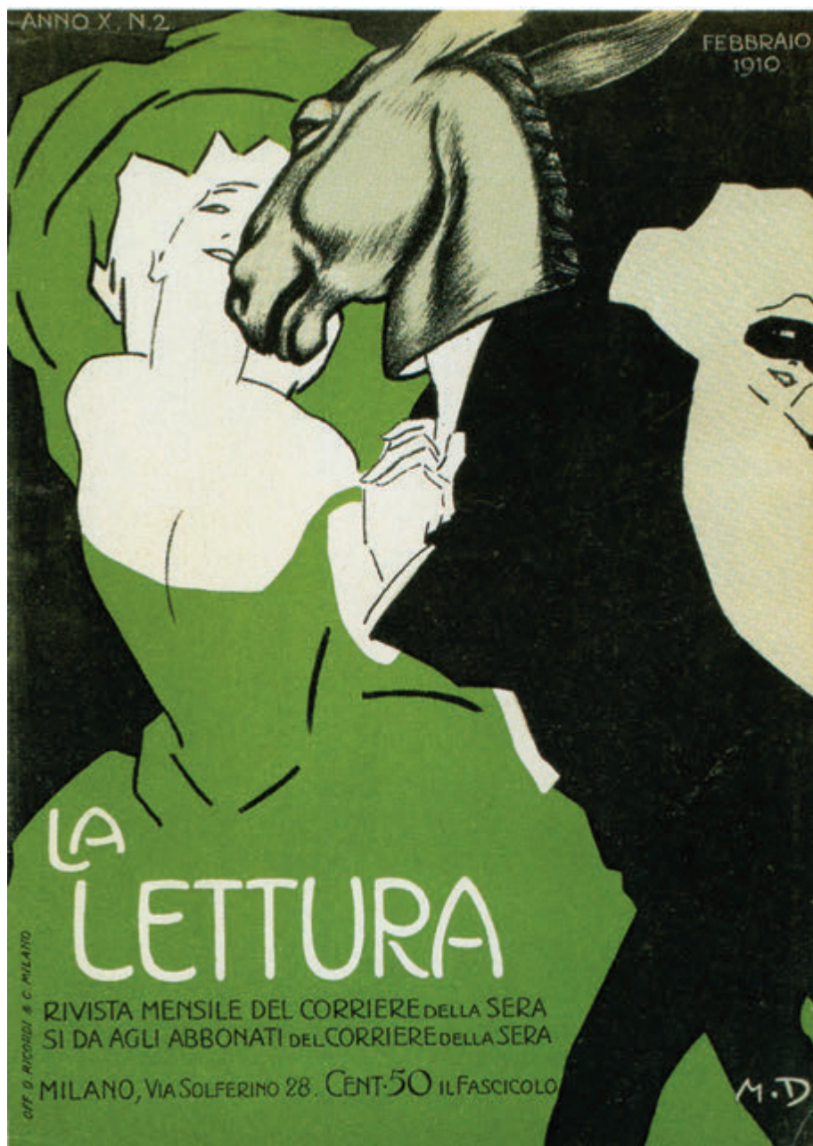
La Lettura. Dudovich, 1910.