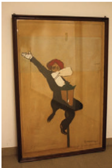
Boceto y cartel para Campari. Capiello, 1909. 140 x 100 cm. Galería Campari, Sesto San Giovanni, Milán.