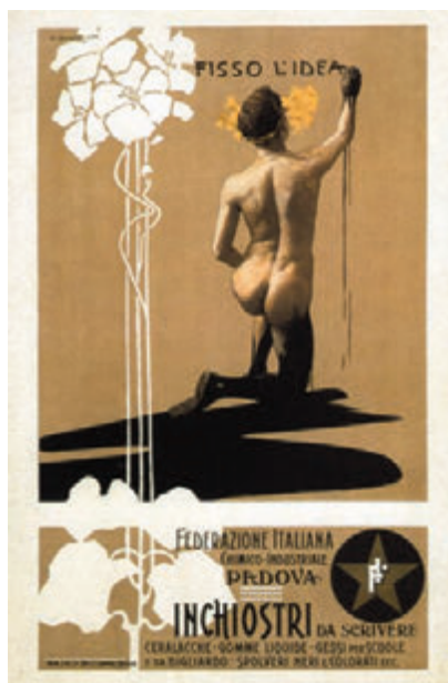
Fisso l'idea . Dudovich, 1899. 67 x 44 cm. Raccolta Salce n° 23387. Museo Civico Luigi Bailò, Treviso.