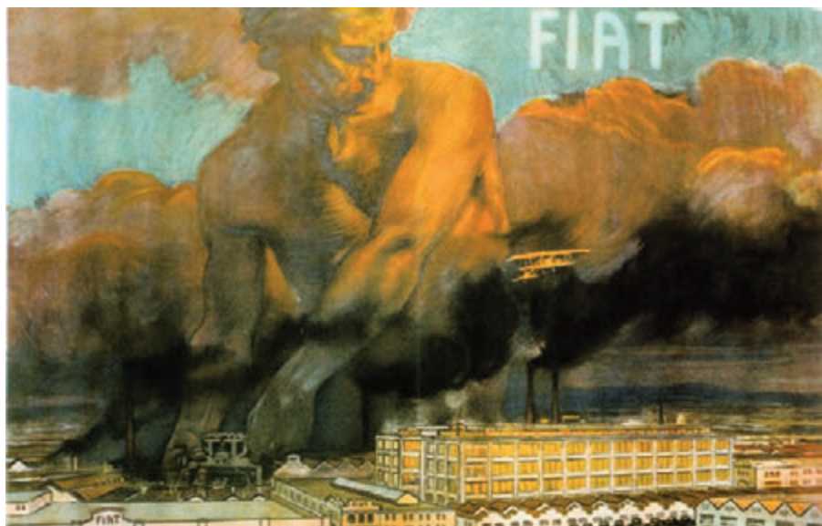
Fiat. Metlicovitz, 1916.

FIAT tiene clara una idea, el producto es nuevo, pero el reclamo debe ser ajustado a los cánones de la tradición. No se permite innovación formal o estilística, hay que ir sobre seguro, no espantar a nadie con ideas o conceptos rocambolescos. Por ello no recurren a los futuristas, siempre dispuestos a glorificar la velocidad, la máquina y el acero. La funcionalidad del producto, así como la direccionalidad de la información han de ser meridianamente claras. Los ilustradores llamados a elaborar las campañas de FIAT lo captaron rápidamente.