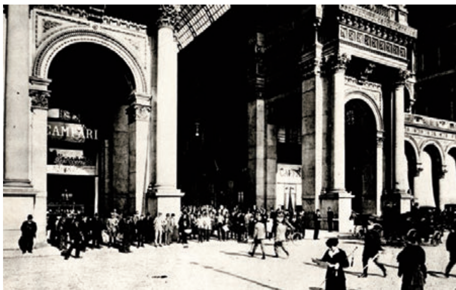
Caffè Campari, Galería Vittorio Emanuele, Milán.