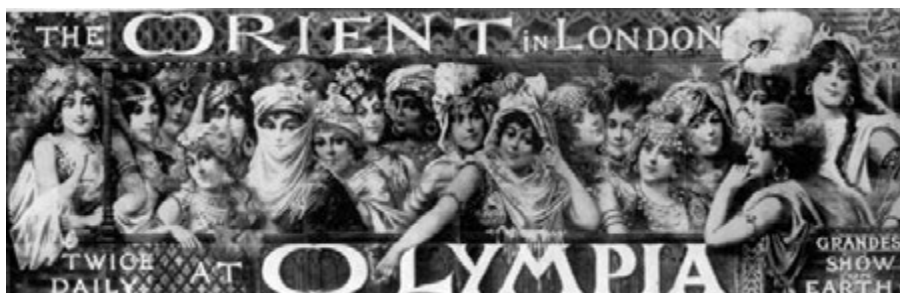
Olympia . Anónimo, 1885. 3 x 18 m.

Ya en 1885 de los talleres Ricordi sale el cartel más grande del mundo, promocionando el Circo Olympia 21 : 3 x 18 metros, entre seis y doce meses de trabajo. Esta fue una proeza técnica encargada por los ingleses a la editorial más avanzada de Europa, capaz de abordar un trabajo de semejantes dimensiones.