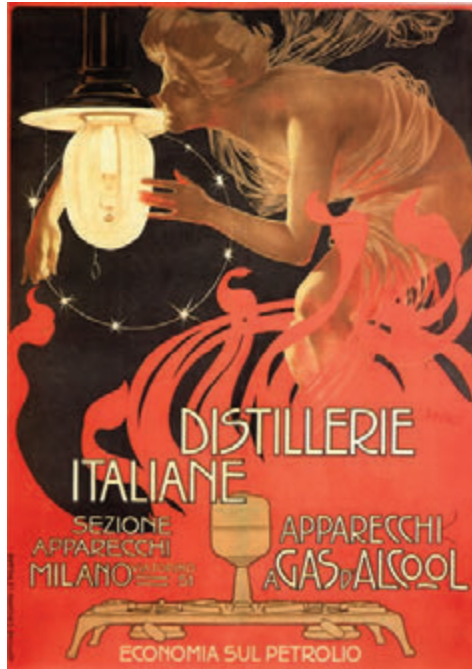
Distillerie Italiane . Metlicovitz, 1897. 140 x 100 cm. Raccolta Salce nº 2630. Museo Cívico Luigi Bailo, Treviso.

es que no lo han visto venir. Todo se paraliza o se reconvierte para estar al servicio de la guerra y de la patria.