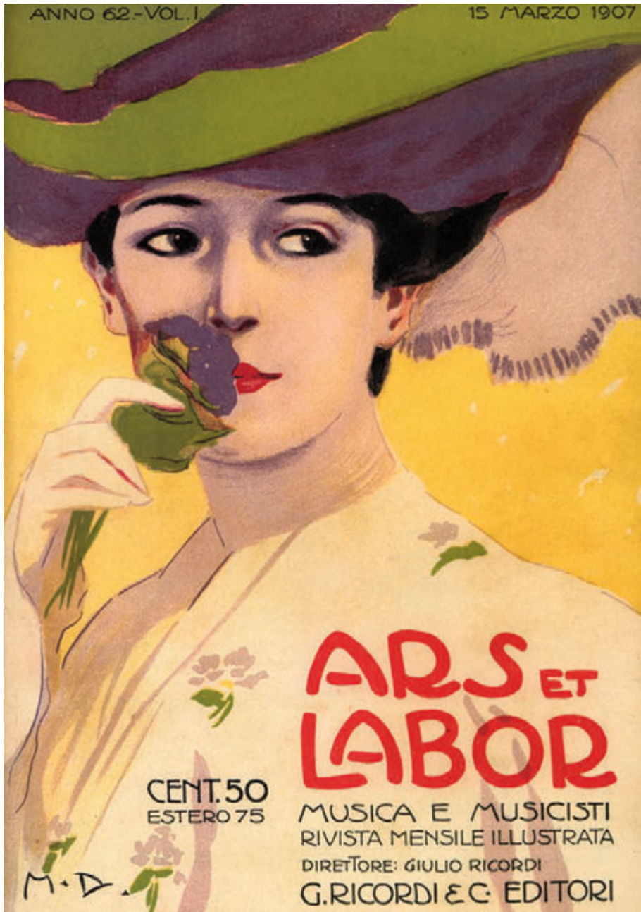
Ars et Labor. Dudovich, 1907.