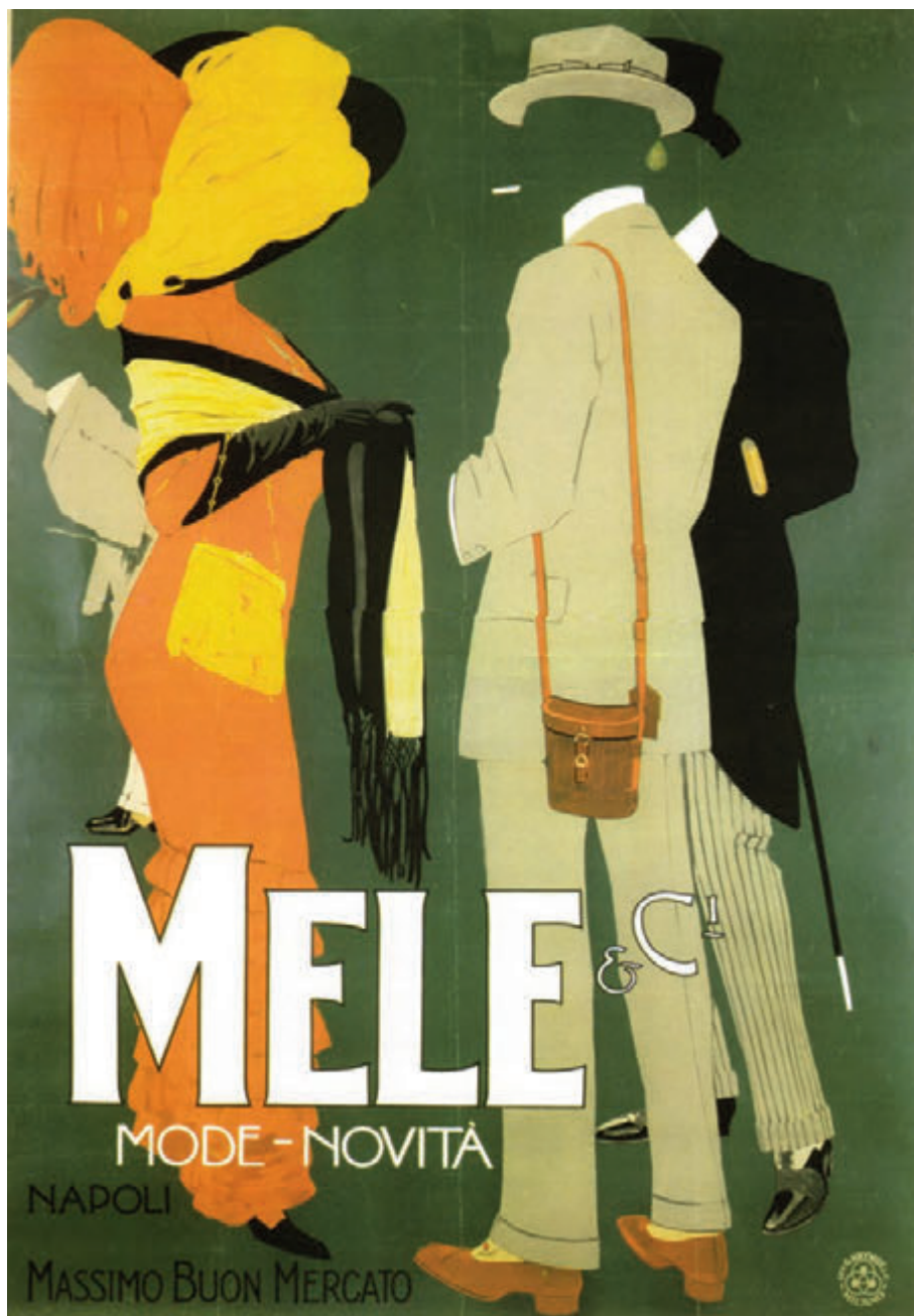
Mele ("Los Fantasmas") . Dudovich, 1910. 200 x 145 cm. Raccolta Salce n° 4033. Museo Civico Luigi Bailò, Treviso.