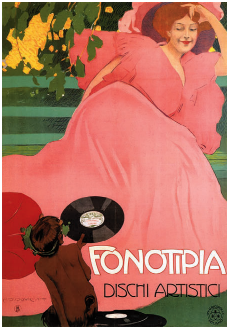
Fonotipia. Dudovich, 1906. 140 x 100 cm.