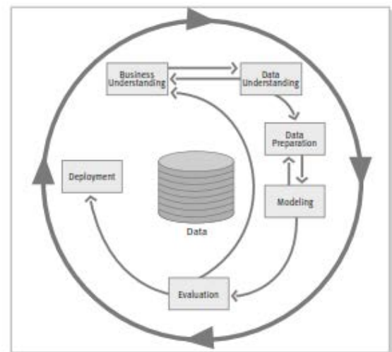
Gambar 1. Fase CRISP-DM model [7]

Bahan utama yang digunakan dalam penelitian ini, adalah data mahasiswa angkatan 2012/2013 Fakultas Teknik, Prodi Teknik Informatika pada Sistem Informasi Akademik (SIMTIK) Universitas Muhammadiyah Ponorogo. Metode penelitian yang digunakan sesuai dengan alur pada Model CRISP-DM ( Cross Industry Standard Process for Data Mining ), langkah-langkahnya adalah sebagai berikut: