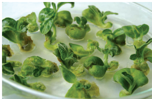
Рис. 2. Регенерация побегов подсолнечника сорта Прометей

Как видно из данных, представленных на рис. 3 (1-3), с увеличением продолжительности культивирования проростков происходило повышение содержания свободного пролина в семядолях и в эксплантате,