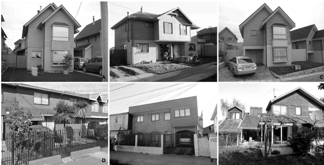
Figura 2. Fotos de las viviendas estudiadas

superficie registrada en la zona ( 60 \text{ m}^2 ) para revisar ejemplos con variedad de recintos que además ilustran el desarrollo inmobiliario local y que generan los más altos consumos energéticos. Los casos estudiados fueron elegidos de una muestra convocada entre estudiantes universitarios, quienes revisaron sus propias residencias o de parientes, quienes se seleccionaron según la diversidad de su estructura familiar y disponibilidad de los usuarios a participar en el ejercicio. En cada vivienda se realizó primero una recopilación de características constructivas, equipamiento y ocupación. Luego, se elaboraron simulaciones computacionales de desempeño térmico, con una modelación zonificada por recintos, efectuando un cálculo dinámico (hora a hora) que permitió obtener resultados de demanda energética mensuales y anuales según un nivel de confort térmico dado. En las monitorizaciones físicas se registraron valores de calidad del aire, iluminación, temperatura y humedad relativa, exterior e interior, en cuatro habitaciones (con sensores superficiales y de aire), durante una semana de verano y otra de invierno. Además, se realizaron ensayos y determinaciones