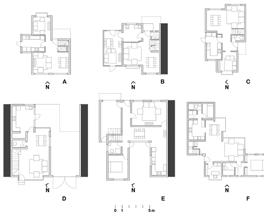
Figura 3. Plantas de las viviendas