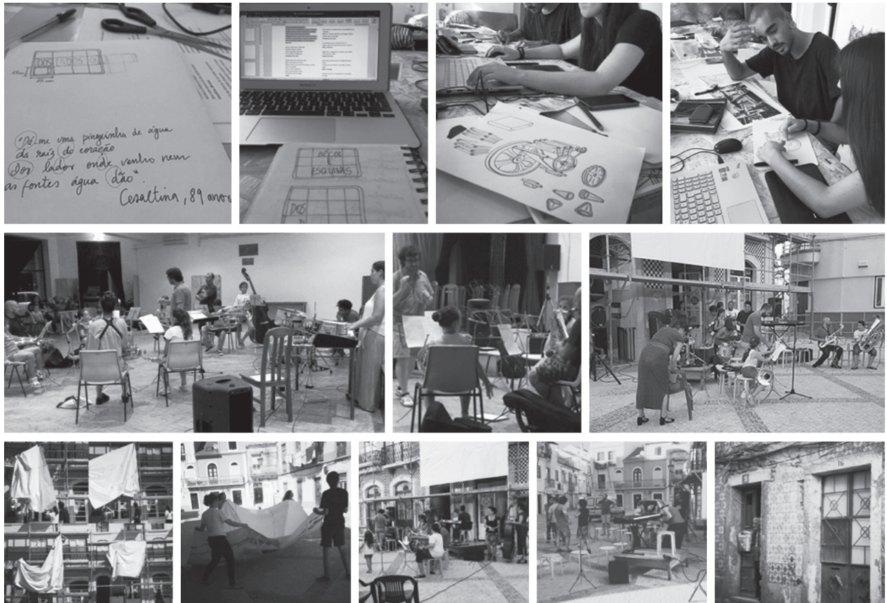
Figura 2 – Criação, ensaios e montagem do espetáculo musical – “Amanhã Temos Bom Dia”.

Os relatos autobiográficos dos participantes mostram, quase exclusivamente, percursos musicais inteiramente assentes na interpretação e na leitura da notação clássica ocidental, com muito esporádicos relatos de participação em processos de composição ou improvisação, circunstância que dificultou, inicialmente, o desenvolvimento das dinâmicas de improvisação coletiva na base das estratégias composicionais delineadas. De facto, uma significativa parte dos músicos revelou, nessa fase, dificuldade em entender como participar sem o apoio de uma partitura, muitos deles afirmando não serem capazes de tocar nem uma frase de memória.