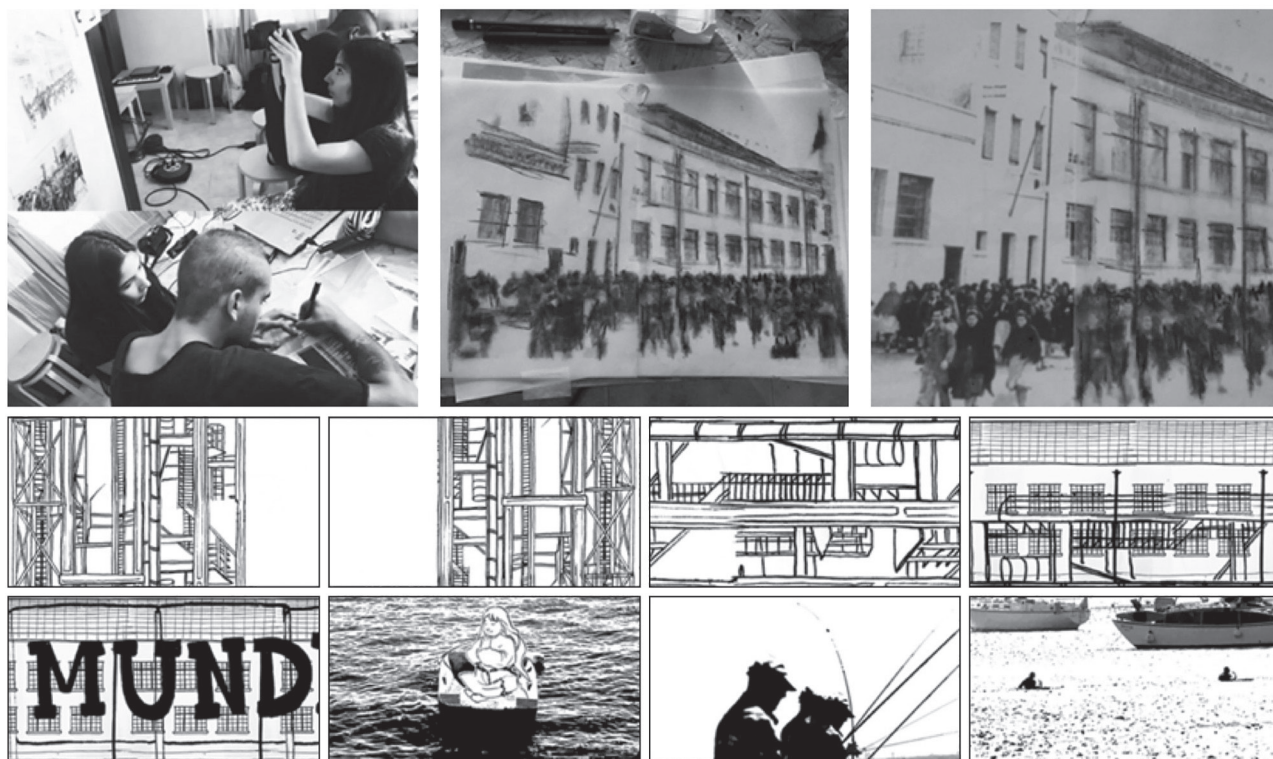
Figura 3 – Ilustrações para a animação vídeo para o espetáculo musical.

reforçando o caráter interdisciplinar deste projeto (Figura 3).