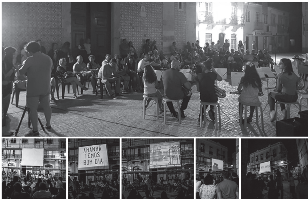
Figura 5 – Apresentação do espetáculo “Amanhã Temos Bom Dia”.

Esta dimensão estético-artística justapõe-se a uma dimensão educativa uma vez que uma das grandes finalidades do projeto seria proporcionar aos estudantes e diplomados da ESELx um conjunto de experiências extraescolares com e para a comunidade. Neste sentido, os processos de trabalho desenvolvidos levantaram um conjunto de desafios no que toca à aquisição de competências de pesquisa artística baseada na comunidade bem como na ligação entre modalidades educativas formais e não formais. De facto, os processos criativos cruzaram-se com a necessidade de estabelecer planos de negociação quer com a comunidade quer com os restantes intervenientes.