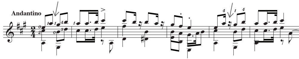
Figura 3 – Fragmento da Fantasia 9, Op. 36, de Fernando Sor

ritmicamente uma passagem que decorre dois compassos antes. Essa alteração na duração da nota é acompanhada de uma digitação diferente à utilizada na primeira vez, o que implica uma mudança de posição (indicação complementar que não está sempre presente em situações similares), como podemos ver na figura 4.