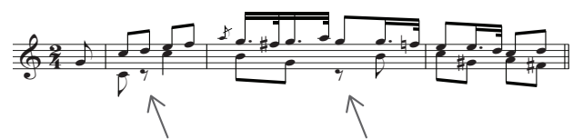
Figura 4 – Estudo 17, op. 29 de F. Sor

Logo depois da anacruse, aparece um dó grave, habitualmente executado na 5. a corda, com uma duração de colcheia, silenciado imediatamente por uma pausa de colcheia. Muitos músicos com alguma experiência na leitura de obras para guitarra clássica poderiam afirmar que uma pausa situada nesse lugar foge bastante da norma. Como já foi