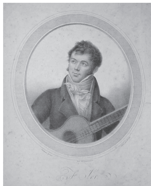
F. Sor

Antes de prosseguirmos com a nossa análise e para efeitos de uma melhor compreensão do que está em causa, consideramos necessário esclarecer o conteúdo semântico de certos termos que utilizaremos durante a nossa exposição.