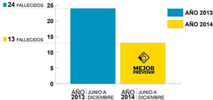
Gráfico N° 3. Número de fallecidos.

dificultad que en muchos países llega a convertirse en un problema de salud pública.