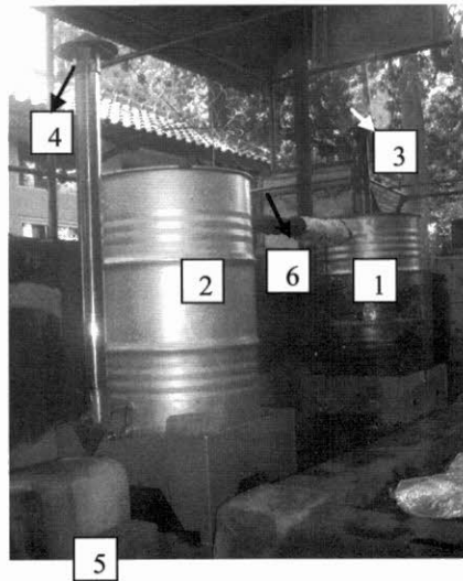
Gambar 1. Tungku arang dan cuka kayu hasil modifikasi Figure 1. Modified charcoal kiln comprised of carbonization drum intregation with wood vinegar condensing device

Peralatan yang digunakan untuk membuat arang dan cuka kayu adalah tungku yang sudah dimodifikasi dan terpadu dengan produk destilat. Tungku terdiri dari 2 buah drum (drum ganda). Drum pertama digunakan untuk pembuatan arang, dimana drum tersebut dilengkapi dengan cerobong asap untuk mengalirkan keluar (ke udara terbuka) gas tidak terkondensasi yang terbentuk selama pengarangan. Drum pertama tersebut dilengkapi pipa untuk mengalirkan segala gas/uap yang dapat terkondensasi, kemudian disambungkan dengan pipa berbentuk spiral yang sudah terpasang dalam drum kedua. Pipa berbentuk spiral tersebut berfungsi mendinginkan asap/uap terkondensasi di dalamnya. Pendinginan asap/uap terjadi karena peranan air yang dialirkan dan ditampung dalam drum kedua. Hasil kondensasi asap/uap tersebut ditampung dan diberi nama cuka kayu. Untuk lebih jelasnya, rincian dan sistim kerja tungku drum ganda tersebut disajikan pada Gambar 1. Alat-alat lainnya yaitu timbangan, golok, gergaji, ember plastik, karung, jerigen plastik, termokopel dan lain-lain.