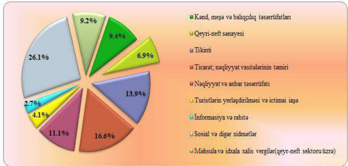
Şəkil 1. 2017-ci il ərzində Azərbaycan Respublikasında qeyri-neft sektorunun inkişafı

Dövlət investisiya proqramının əsas məqsədi ölkə iqtisadiyyatının, xüsusilə, qeyri-neft sektorunun dinamik inkişafına, əhalinin iqtisadi və sosial tələbatlarının daha dolğun təmin olunmasına, regionların inkişafına, ölkənin iqtisadi təhlükəsizliyinin təmin edilməsinə, ətraf mühitin mühafizəsinə yönəldilmiş dövlət əhəmiyyətli investisiya layihələrinin sistemli və səmərəli şəkildə həyata keçirilməsini təmin etməkdən ibarətdir. [8]