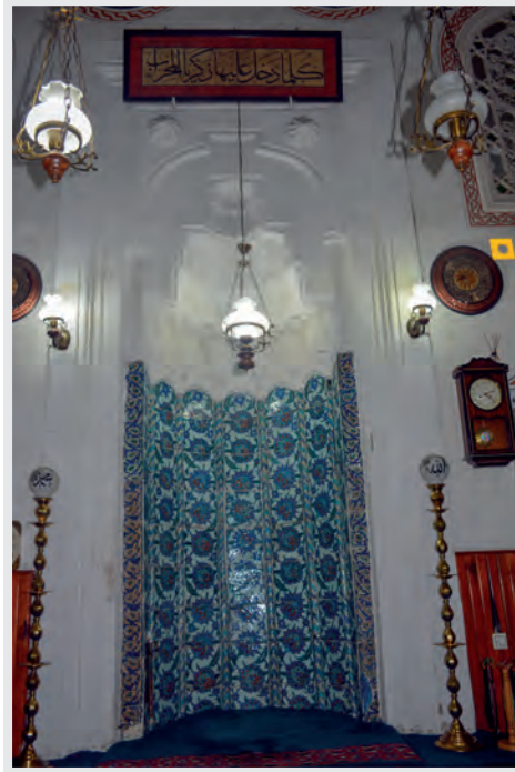
Resim 10. Mihrap