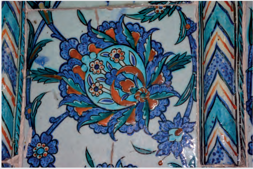
Resim 12. Mihrap Çinisi, Detay