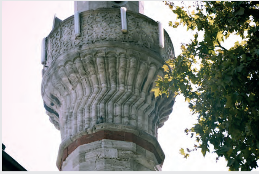
Resim 9. Minare