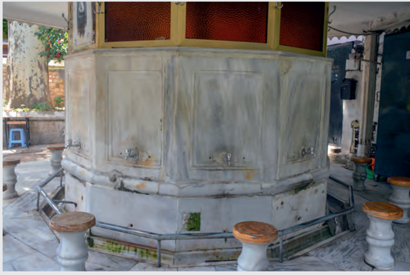
Resim 3. řadirvan