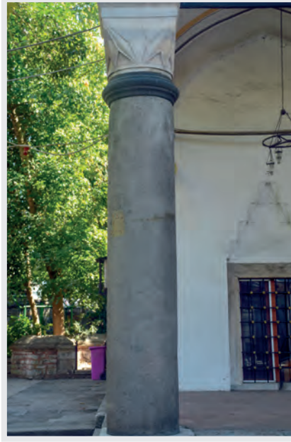
Resim 5. Tonalit Kayası Bileřiminde Sütun