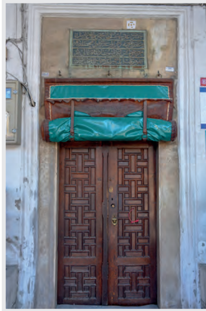
Resim 6. Giriř Kapısı ve Kitabe