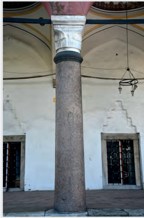
Resim 4. Asvan (Assuan) Graniti Stn