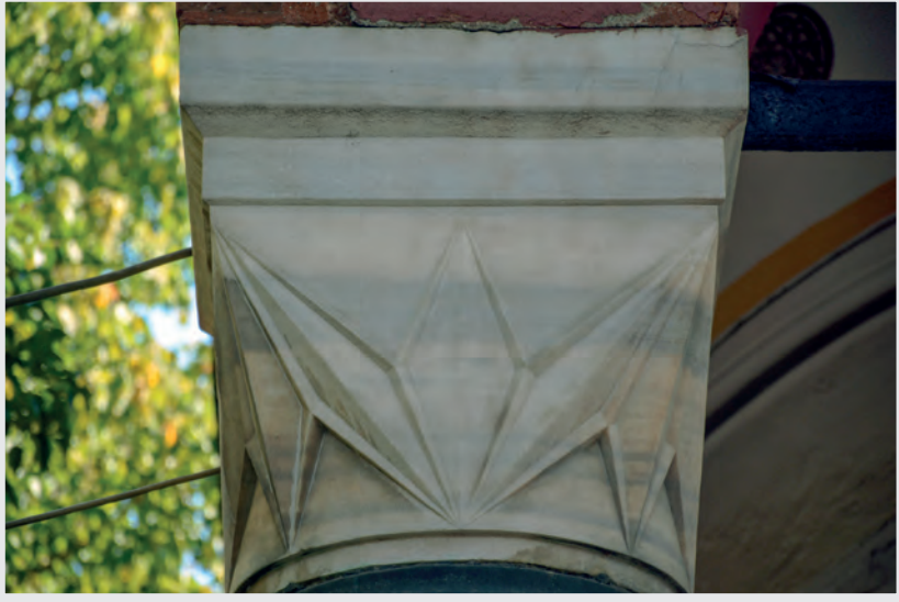
Resim 7. Sütun Başlığı