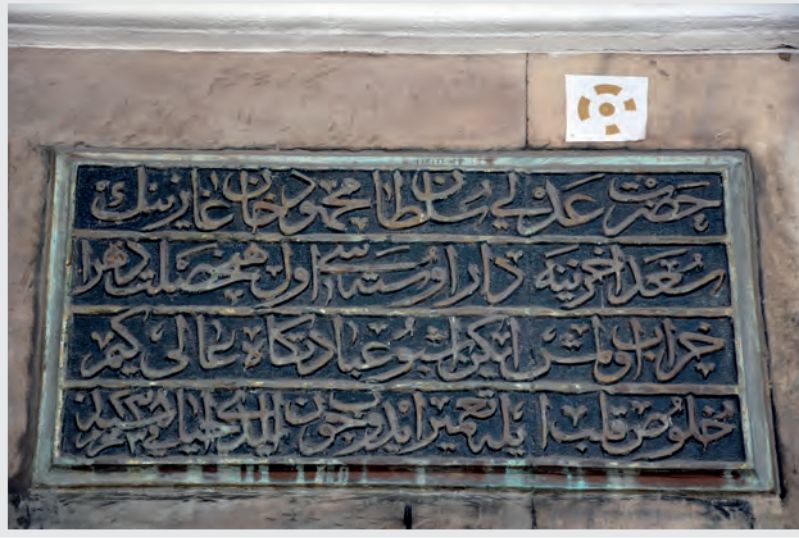
Resim 1. Onarım Kitabesi