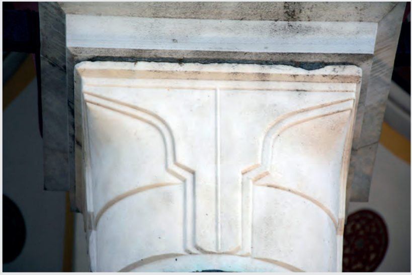
Resim 8. Sütun Başlığı