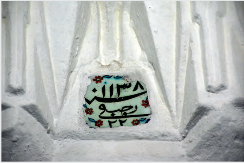
Resim 11. Mihrap, Çini Levha