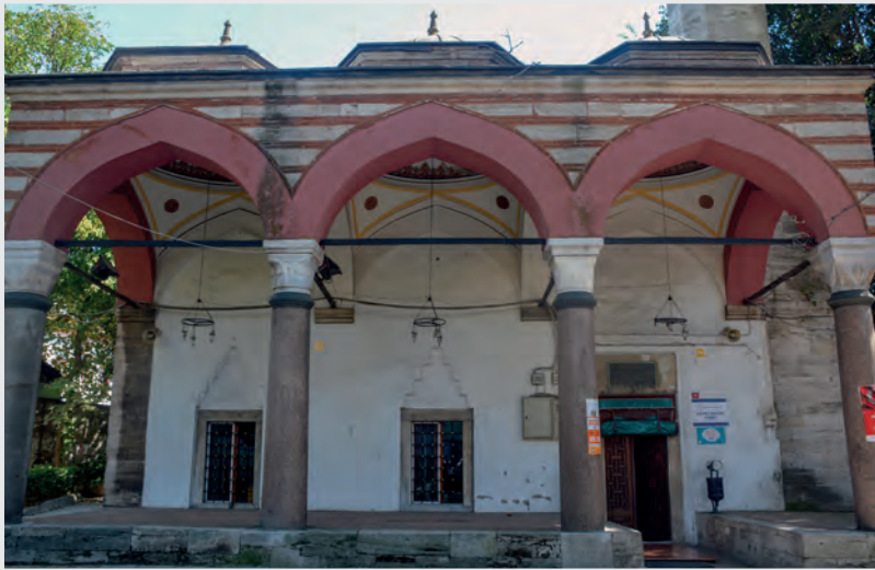
Resim 2. Son Cemaat Yeri