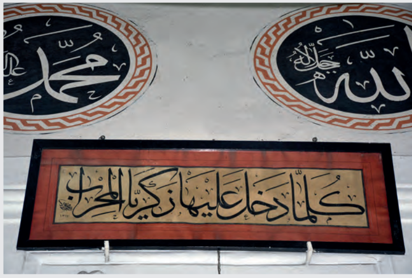
Resim 13. Mihrap Tepeliđi