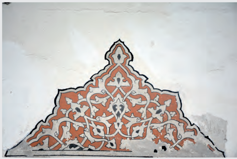
Resim 16. Pencere Alınlığı Sslemesi