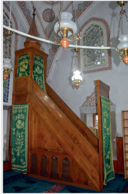
Resim 14. Minber