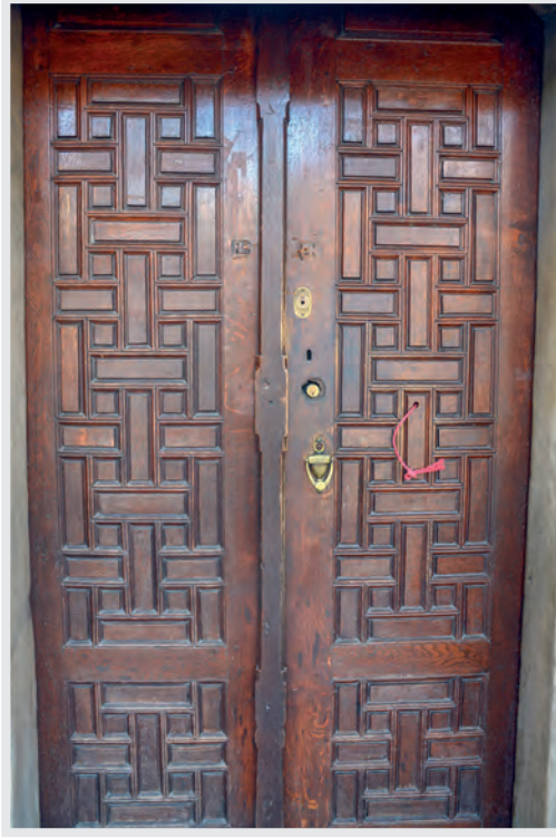
Resim 15. Giri Kapısı