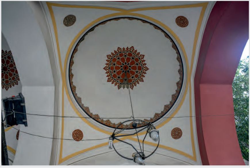
Resim 17. Son Cemaat Yeri Kubbesi