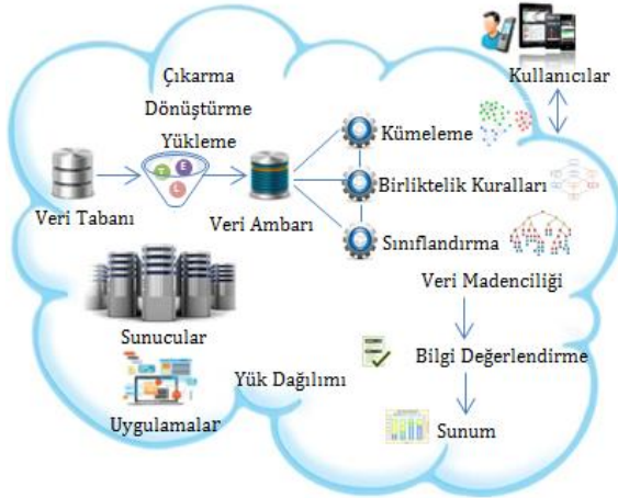
Şekil 1: Bulut platformunda veri madenciliği yöntemlerinin kullanılması.