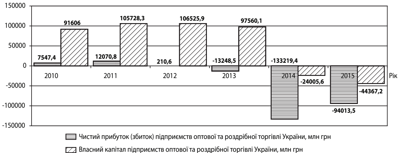
Рис. 1. Динаміка отриманого чистого прибутку (збитку) та власного капіталу підприємств України за видом діяльності: оптова та роздрібна торгівля; ремонт автотранспортних засобів і мотоциклів за період 2010–2015 рр.