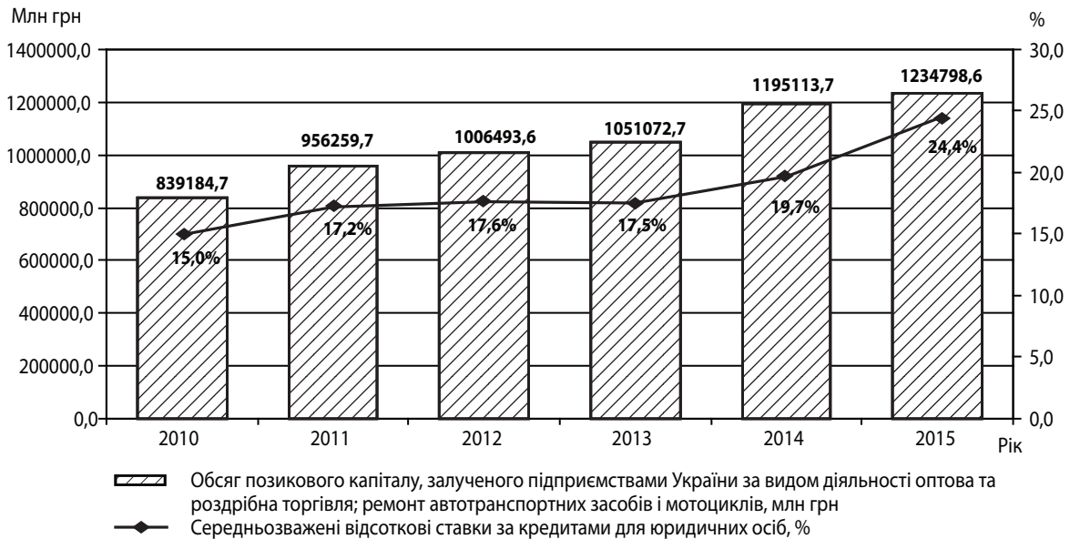
Рис. 3. Динаміка обсягу позикового капіталу, залученого підприємствами оптової та роздрібною торгівлі України, та рівня середньозважених відсоткових кредитних ставок для юридичних осіб за період 2010–2015 рр.