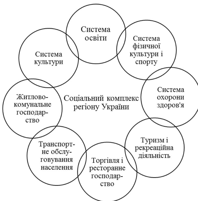
Рисунок 1 – Структура соціального комплексу регіону

Соціальний комплекс регіону, на нашу думку, є сукупністю видів економічної діяльності, спрямованих на задоволення потреб населення, що включають: системи освіти і охорони здоров'я, сферу культури, житлово-комунальне господарство (ЖКГ), транспортне обслуговування населення, торгівлю і ресторанне господарство, туризм і рекреаційну діяльність (рис. 1).