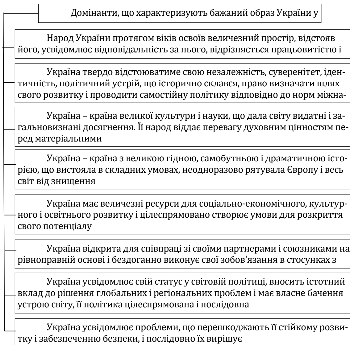
Рисунок 3 – Домінанти, що характеризують позитивний імідж України у світі

Однією з умов необхідного сприйняття нашої країни у світі є наявність її сформованого бажаного образу. Він виступає як сукупність представлень, які склалися про неї у цільових групах за кордоном, що забезпечують задане сприйняття країни. Такий імідж сприяє рішенню актуальних зовнішньополітичних завдань і забезпечує реалізацію національних інтересів. Бажаний імідж України за своїм змістом є сукупність її характеристик, які необхідно донести до цільових груп. З урахуванням викладеного пропонується наступний перелік домінант, що характеризують бажаний образ України у світі (рис. 3).