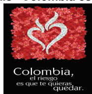
Grafico 2: Marca país “Colombia es pasión”.