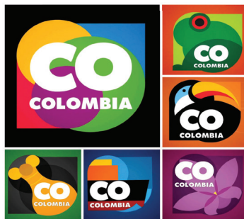
Grafico 3: Marca país.

Fuente: Ministerio de Comercio industria y turismo. Colombia.