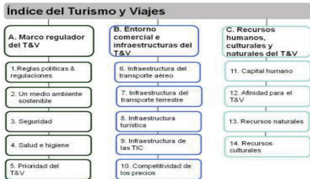
Gráfico 2: Composición de índice de competitividad de turismo del foro económico mundial.