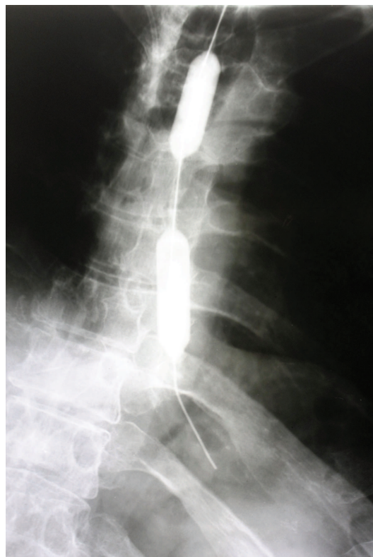
Рисунок 2 – Баллон в зоне стриктуры.