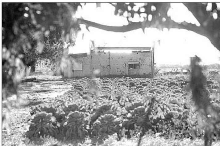
LAS NAPAS del sector están contaminadas por diversos elementos.

El 20% habita el lugar desde hace más de 10 años y ha consumido ese líquido desde entonces; el resto son trabajadores "golondri-