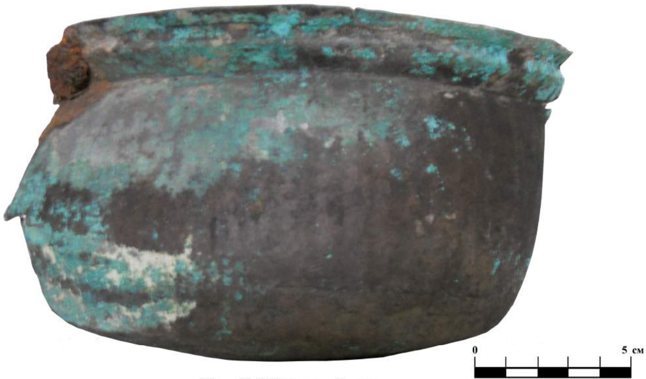
Мал. № 1 Бронзовий казан.