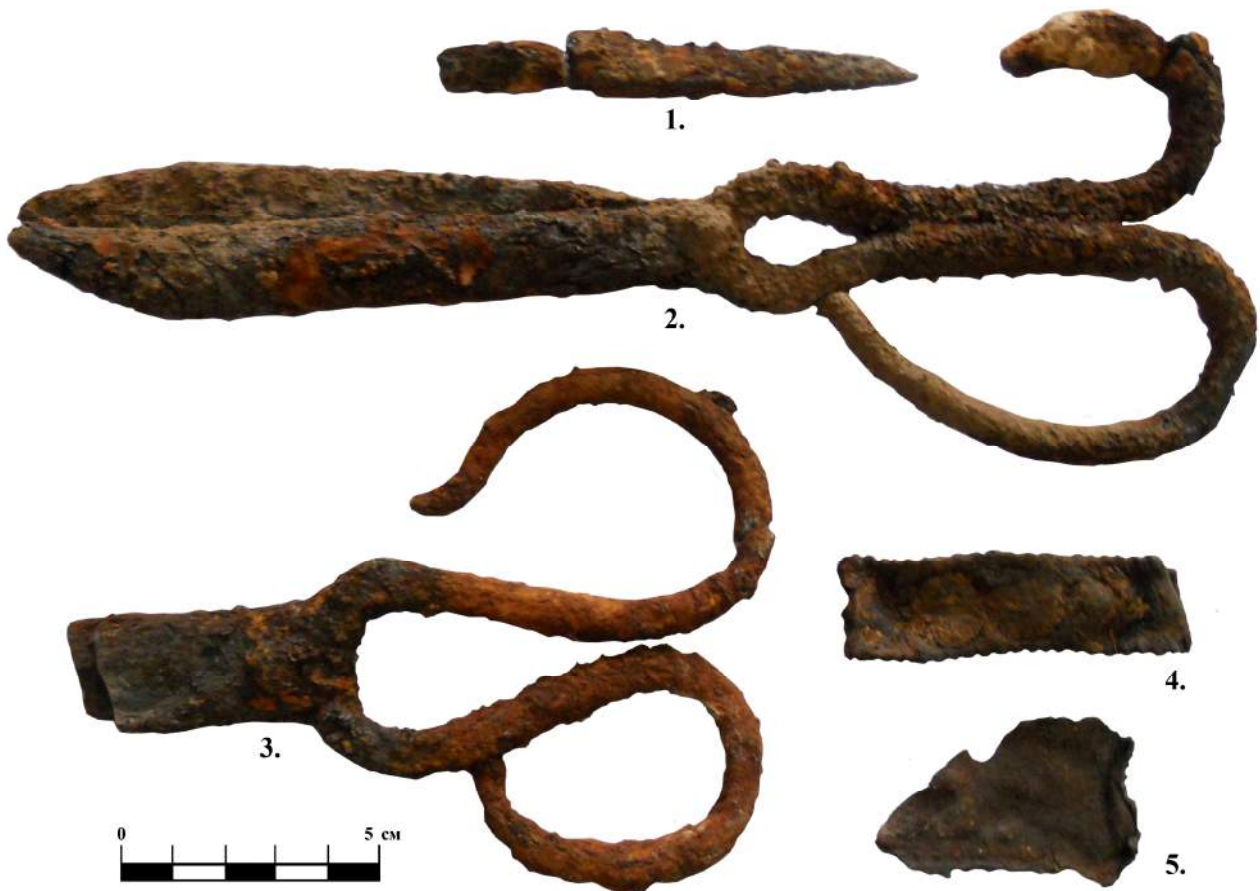
Мал. № 2 Залізні предмети: 1. Ніж 2. Перші ножиці 3. Другі ножиці, Шкіряні предмети: 4. Фрагмент паска 5. Фрагмент шкіраного виробу.