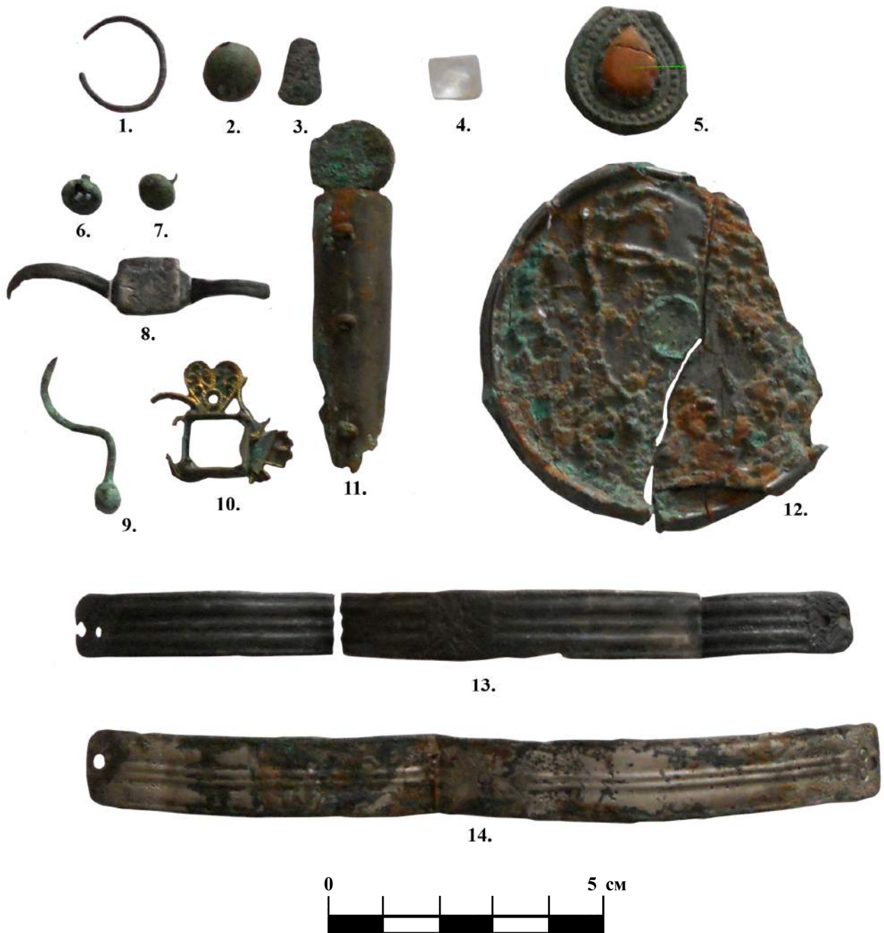
Мал. № 3

1. Серезка 2.Бляшка опуклої форми 3. Предмет у вигляді витягнутої трапеції 4. Пірамідальний камінь 5. Бляшка каплеподібної форми 6. Намистина з наскрізним отвором 7. Намистина з круглим вушком 8. Перстень 9. Серезка у вигляді знаку «?» 10. Ажурна підвіска 11. Циліндричний футляр 12. Дзеркало 13. Перший браслет 14. Другий браслет