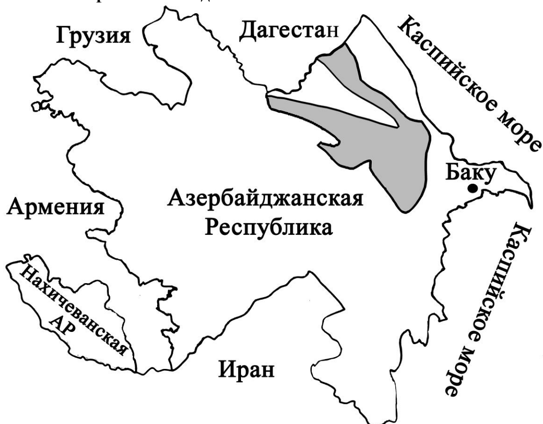
Рис. 1. Карта-схема Азербайджанской Республики (участок исследования отмечен тёмным цветом).

Основным источником для подготовки статьи являются данные мониторинга, который был проведен Ш.М. Джафаровой и А.Т. Мамедовым под руководством Г.Т. Мустафаева, в 2013–2016 гг. в лесах Губы и Алтыгача. Проведение орнитологического мониторинга приобрело уже традиционный характер (Аскеров и др., 2009; Мустафаев, 1985; Мустафаев, 2003; Садыгова, 2006; Ханмамедов, Мустафаев, 1965; Ханмамедов, Мустафаев, 1960). Авторы пользовались в основном точечным мониторингом. Всего было исследовано 60 точек, которые охватили все биотопы района. Размер каждой точки варьировался от 25x25 м для мелких птиц, до 250x250 м – для крупных. Долго и сильно отпуганные хищные птицы подсчитаны традиционным маршрутным методом, длиной до 100 км. Поездка осуществлялась верховым и на автомобиле со скоростью до 30 км/час. Повторность учета птиц 3 раза в год (май, июнь, июль) на каждой точке мониторинга и маршрута наблюдений. Гнездовая элиминация птиц установлена путем сравнения числа особей в начале и в конце их репродукции. Для определения годовой элиминации сравнивали плотность популяции конца репродукции любого года с началом таковой следующего года. Экологическая оценка птиц осуществлялась мультипараметрным методом (Мустафаев, 2003).