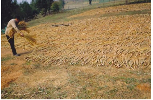
Fotođraflar 2: Sprge Kamıřının Kurutulması, Tanelerinin Temizlenmesi

Tarladan kaldırılan sprge kamıřının gnlk hayatımızda kullanmaya bařlanabilmesi iin belirli ařamalardan gemesi gerekmektedir.