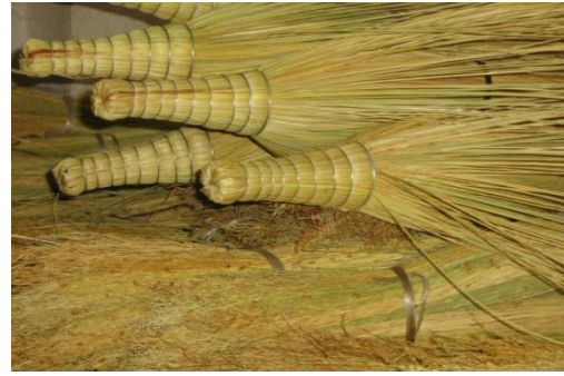
Fotođraflar 16: Tepeleri Hazırlanan ve Dikim İřlemine Hazırlanan Kamıřlar

Demet haline getirilen ve tepesi hazırlanan kamıřlar makine vasıtasıyla dikilir ve yassılařması sađlanır. Dikiř makinesinde sprge hem preslenerek yassı řeklini almakta hem de dikiřleri atılmaktadır. Her sprgeye 5 sıra dikiř atılmaktadır. Dikim makinesi 10 yıldır kullanılmaktadır. nceki yıllarda btn iřlemler elle yapılmaktaydı.