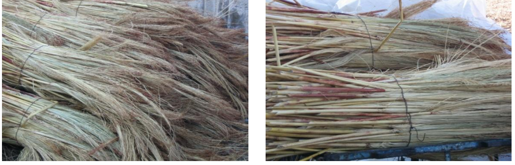
Fotođraflar 3: Sprge Kamıřlarının İřlenmeye Bařlamadan nce Islatılması

Kkrtleme: Kamıřların ıslanmasından sonra gelen ařama kkrtlemedir. Bu iř iin kkrt ambarları kullanılır. Islatılan kamıřlar kurutulmadan ıslak halleriyle kkrt ambarlarına tařınır ve istif edilir. Kkrt ambarları; penceresi olmayan, hava almayan, kk odalardır.