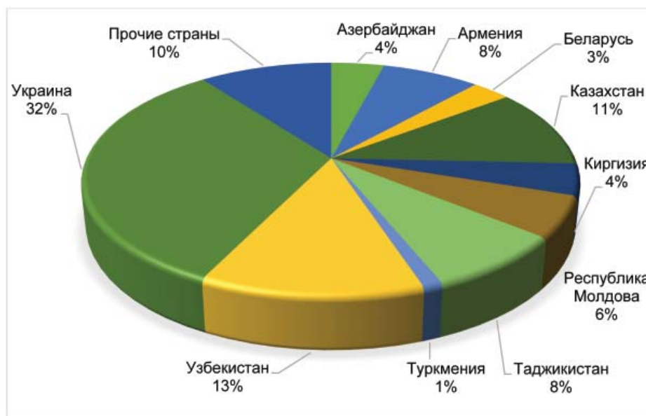
Рис. 2. Структура притока мигрантов в Российскую Федерацию в разрезе стран (по состоянию на 2015 год) 2

ся косвенным свидетельством того, что в Беларуси сохраняется определенная социально-экономическая стабильность, обеспечивающая нормальную занятость населения.