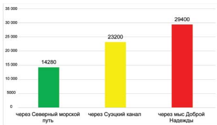
Рис. 2. Протяженность морских путей из Европы на Дальний Восток, км