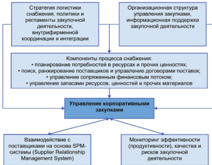
Рис. 1. Развитая система управления корпоративными закупками зарубежом 2

ков на местах. Выбор степени централизации и децентрализации системы управления закупками зависит от совокупности определенных факторов и условий, важнейшими из которых являются следующие факторы и условия: